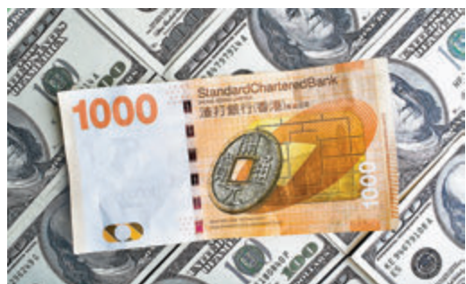
大型中概股回港第二上市，吸引資金湧入港元。