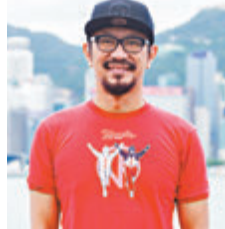
《一水南天》聯合導演朱栢謙