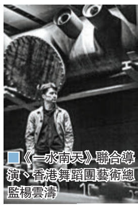
《一水南天》聯合導演、香港舞蹈團藝術總監楊雲濤