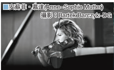
安蘇菲·慕達(Anne-Sophie Mutter)