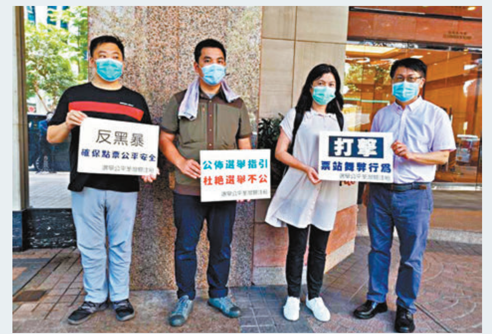
選舉公平荃灣關注組成員請願，促請選管會公布防止選舉暴力及選舉不公的措施。

香港文匯報訊 多個市民團體昨日自發到選管會請願，要求選管會在今年立法會選舉中設立長者關愛通道、防止暴力及選舉不公，以及採用電子選票等。