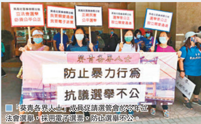
「葵青各界人士」成員促請選管會於今年立法會選舉，採用電子選票，防止選舉不公。