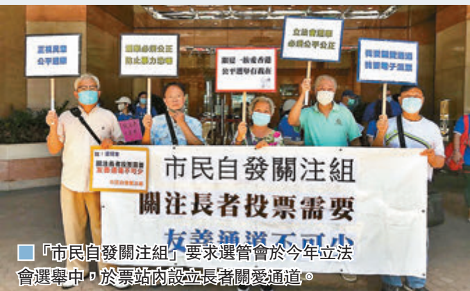
「市民自發關注組」要求選管會於今年立法會選舉中，於票站內設立長者關愛通道。