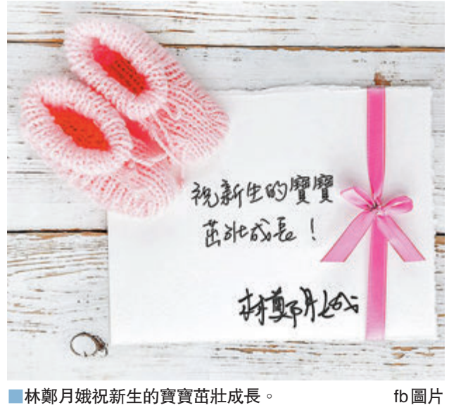
■林鄭月娥祝新生的寶寶茁壯成長。 fb圖片

執行時間上，我可以率先透露我的要求是局方應盡量參考近日推行『保就業』計劃的經驗，爭取提早一年，即在今年年底前生效。」 「作為香港首位女性行政長官，我很高興能在任內推動婦女的發展和權益，在此向每一位將為人母的女士，送上最誠摯的祝福！」林鄭月娥說。 民記月初倡條例今年內實施 民建聯立法會議員鄭泳舜表示，民建聯在本月初約見勞福局局長時，已要求政府必須縮短落實有關措施的18個月準備期，讓條例可在今年內實施。特首昨日宣布可提前一年，即於今年底實施新產假的安排，及承諾提高由政府支付的薪酬上限，民建聯對此表示歡迎。 他指出，有關條例將於6月24日恢復二讀，「反對派不要再玩嘢拉布，令延長產假一拖再拖。」