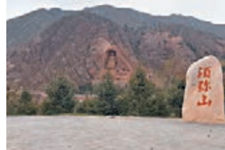
中國十大石窟之一寧夏須彌山石窟