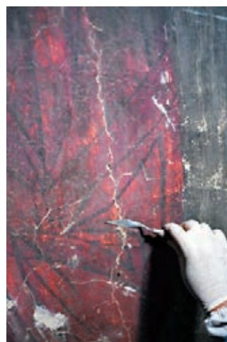
文物修復專家在寧夏須彌山石窟圓光寺48號窟內修復壁畫

甲等病害。此次修復將遵循「最小干預，修舊如舊」的原則，盡可能最大程度還原壁畫的原始風貌。