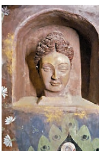
待文物專家修復的精美石像

據了解，須彌山石窟坐落在位於古絲綢之路東段北道的寧夏固原市六盤山北麓，初創於北魏晚期，興盛於北周和唐代，距今已有1,500多年的歷史，是寧夏境內最大的石窟群，也是中國十大石窟之一。因自然風化和人為損壞，須彌山石窟壁畫出現了地仗脫落、裂隙、顏料層粉化脫落、空鼓、壁畫起