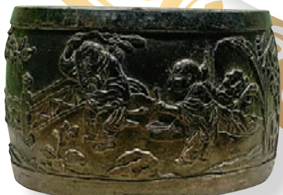
明宣德款澄泥嬰戲紋蟋蟀蓋罐(連蓋)。