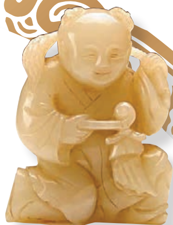
清青玉五穀豐登娃娃