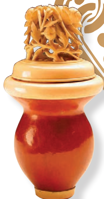
清牙蓋葫蘆蝈蝈罐