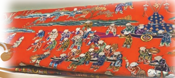
曾在紫禁城鐘粹宮後殿使用的紅呢平金彩繡百子雙喜炕圍首次展出。