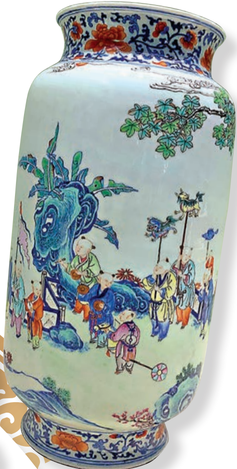
一級文物清乾隆粉彩十六子燈籠瓶。