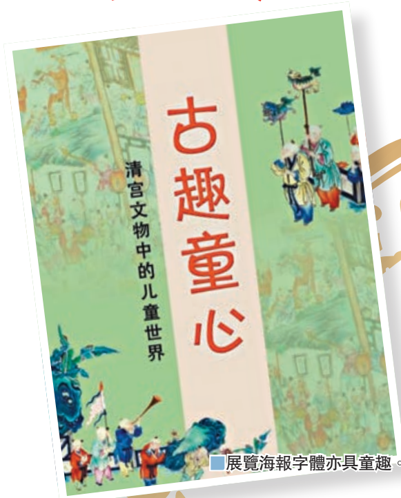
展覽海報字體亦具童趣。

國際六一兒童節剛剛過去，其間瀋陽故宮特別遴選出50件(套)館藏文物，策劃推出「古趣童心——清宮文物中的兒童世界」展覽。雕工精美的琴棋書畫文具盒、取材罕見的蟋蟀蓋罐、流傳至今的驢皮影、裝飾繁多的皇家小馬鞍……在一件件色彩鮮艷、童趣十足的文物中，觀眾得以一窺清代兒童的生活世界。特別是首次展出的清朝第一位幼年繼位的順治帝福臨曾使用過的牛角樺皮小弓，呈現出了皇家兒童不一樣的玩樂生活。