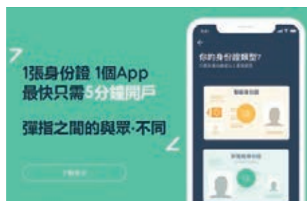
■目前已有5間虛銀在金管局沙盒進行測試。圖為眾安銀行的官網圖片。

香港文匯報訊（記者 馬翠媚）疫情打擊經濟，銀行資產質素備受關注。金管局副總裁阮國恒表示，受環球經濟增長放緩和疫情影響，本港銀行資產質素輕微轉差，不過銀行的特定分類貸款比率仍保持於約0.6%，與其他主要經濟體相比為低，在國際上仍屬非常穩健的水平。