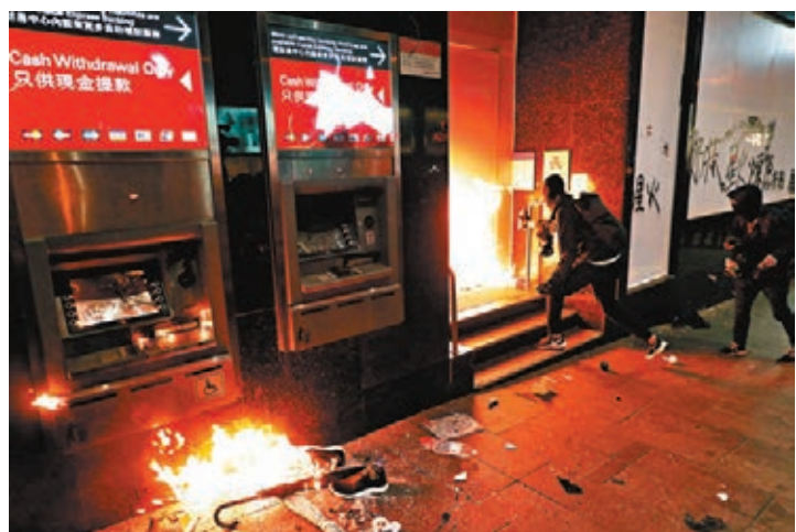
■滙豐香港分行在今年暴力活動中也遭破壞。