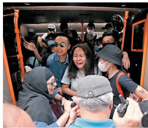
暴力行為阻礙交通，令巴士乘客焦急痛哭。資料圖片