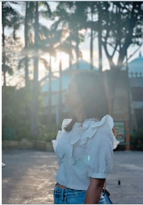
梁真真直言因黑暴肆虐，最終無奈離港。