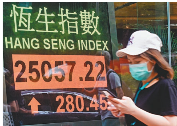
恆生指數昨收報25,057點，上升280點或1.13%，全日成交金額1,243億元。

另外，收租相關股份獲資金追捧。九倉置業(1997)昨收報35.9元，升1.95元或5.74%，是表現最好的藍籌股。領展(0823)昨收報68.55元，升2.4元或3.63%。港鐵(0066)昨收報42.6元，升1.45元或3.52%。長實(1113)昨收報47.8元，升1.05元或2.25%。