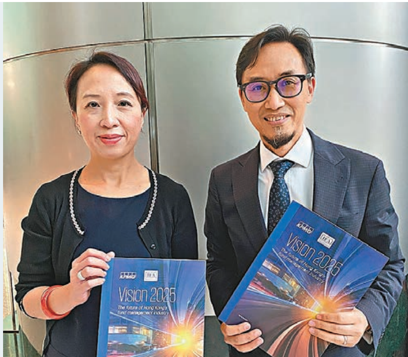
近六成受訪基金公司已有或將有大灣區戰略計劃