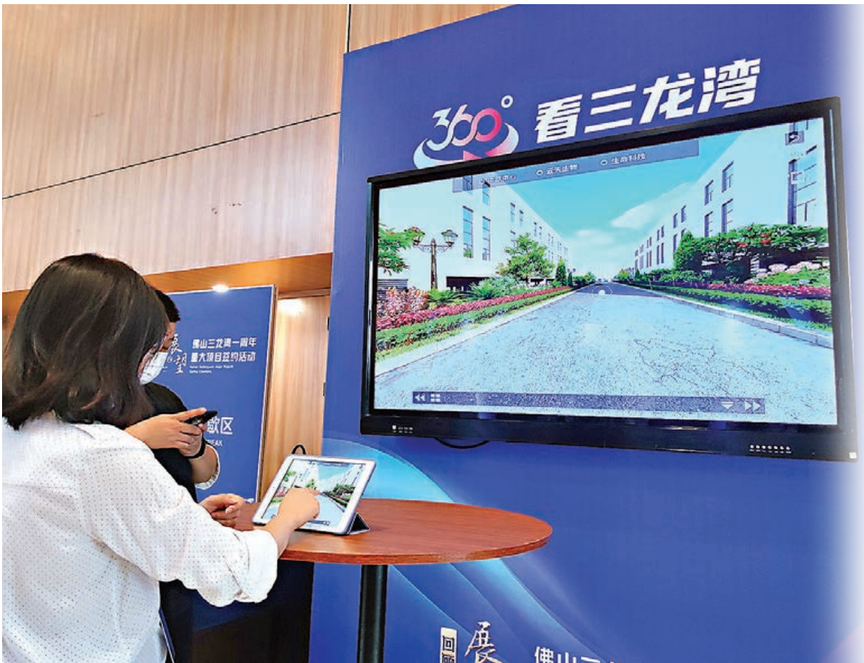
■民眾在展示板上360度「雲觀看」三龍灣建設情況。

移遠通訊研發中心計劃一年引入100人、三年引入1,000人規模組建研發團隊，並引入上下游企業，針對粵港澳大灣區及周邊區域的產業發展方向，進行5G模組的設計和研發。而三龍灣智慧通訊運營項目，則圍繞智慧燈杆等5G基礎設施運營，加快片區5G基站建設、促進城市產業升級。此外，富士康工業互聯網股份有限公司聯手佛山三龍灣