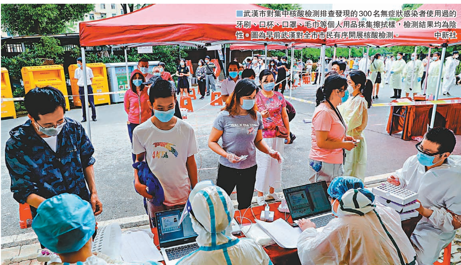
武漢市對集中核酸檢測排查發現的300名無症狀感染者使用過的牙刷、口杯、口罩、毛巾等個人用品採集擦抹樣，檢測結果均為陰性。圖為早前武漢對全市市民有序開展核酸檢測。

他也指出，300名無症狀感染者的痰液和咽拭子樣本全部送至中科院武漢病毒所進行病毒分離培養，結果的科學性有保障。據了解，繼湖北省武漢市、黑龍江省牡丹江市開展全民核酸檢測後，湖北省鄂州市係第三個進行全市核酸檢測的城市。6月8日，毗鄰武漢的湖北鄂州市，也發布了新型冠狀病毒感染的肺炎防控指揮部通告，表示將於2020年6月11日至6月17日對全市未進行核酸檢測的人員，集中進行核酸檢測篩查。集中檢測期間，自願自費進行核酸檢測人員的費用由政府補貼50%。目前，鄂州的新冠肺炎確診病例已經清零，截至2020年5月31日24時，鄂州市累計報告新冠肺炎病例1,394例，該市的常住人口約為105.97萬人。