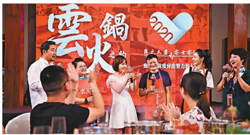
6月6日，馬雲在安徽合肥稻香樓賓館「擺下」6桌火鍋，邀請66名安徽援鄂湖北醫療隊隊員一起吃火鍋。

毒，人體接觸這種新病毒後，無論是否出現臨床症狀，免疫系統均會發生相應反應，生成針對病毒的特異性抗體。研究提示，在暴露於病毒後3天至5天內血清中便可檢測到這種抗體，抗體可持續存在至少28天。因此檢測血清新冠病毒特異性抗體可以反映受檢者近期是否曾接觸過或感染過新冠病毒，從而更準確地評估新冠病毒累積感染率及流行程度。需要指出的是，血清新冠病毒特異性抗體陽性並不代表受檢者當下有新冠病毒肺炎。目前也不清楚檢測到的抗體是否具有保護性。