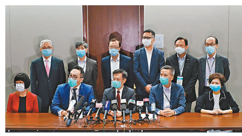
旅遊業界建議放寬旅行團的限聚令，由目前最多八人聚集增至二十三人，以便推行本地遊。

與疫情受控的鄰近地區建立兩地健康檢測互認制度，例如與澳門成立健康碼互認，他相信一兩個月內，港澳建立「旅遊氣泡」的研究將有結果，其後會擴展至其他短途城市，冀9月可陸續開通短途旅遊線。他透露，上周曾與食物及衛生局局長陳肇始會面，知悉粵港澳建立健康碼的工作接近完成，但他認為現時病毒檢測證明費用高昂，希望相關費用能夠調低，「未來應該先在水陸路線試行，之後才擴展至空路交通。」香港旅行社解困大聯盟召集人姚柏良引述陳肇始指出，雖然未有具體建立健康碼的時間表，但有研究已接近完成，惟強調實行時需視乎雙邊安排，不只是香港單邊能夠決定。姚柏良續說，在最多8人聚集的限聚令下，難以推動本地遊，「人數上限太少難以成團，以往是以一架旅遊巴士計算，每團約50人，若推動微型本地遊，成本會好高，經營相當困難。」旅遊界立法會議員姚思榮認為，食衛局可在平衡風險下，放寬限聚令上限人數，以免增加業界的經營成本。黃進達亦透露，政府對綠色本地遊計劃的態度正面、開放，但期望政府能夠放寬部分條件限制，容許本地遊每團人數介乎二三十人。