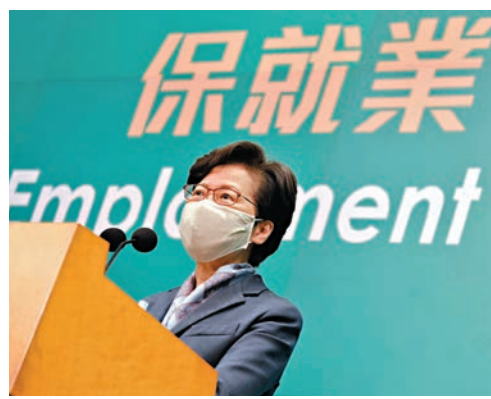
林鄭月娥呼籲有需要的企業盡快提出申請，毋須擔心被「污名化」。

疫情下很多僱主都不聘請人手，應屆畢業生以至來年的畢業生都較難找工作，林鄭月娥表示，政府部門今年暑假已經「加碼」開