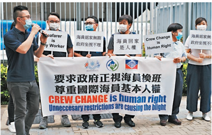
林先生（左一）希望政府能夠放寬對商船船員的措施限制。

香港文匯報訊（記者 文森）新冠肺炎自今年初肆虐全球，各國為控制疫情，封鎖邊境及限制出入境，不少商船的船員也無法落船上岸，回鄉無期。更有香港船員飄洋過海7個月，至今歸家遙遙無期。有海員工會指出，疫情下全球每月約15萬名船員無法落船換班，精神受着很大壓力，希望香港政府放寬上岸限制，容許通過檢測的船員落船回家。