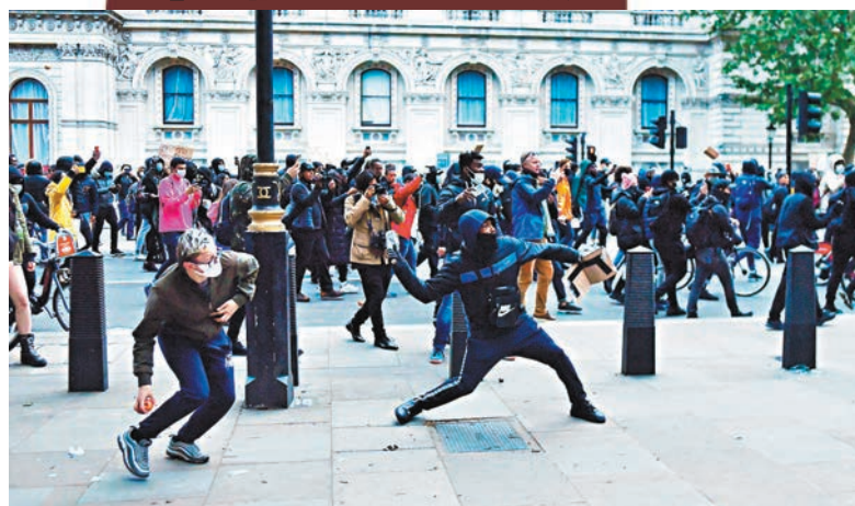
示威者向警方拋擲物件。