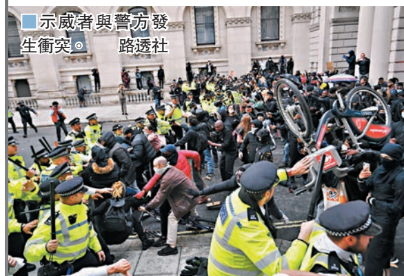
示威者與警方發生衝突。