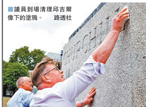
議員到場清理邱吉爾像下的塗鴉。