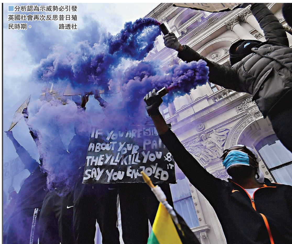
分析認為示威勢必引發英國社會再次反思昔日殖民時期。