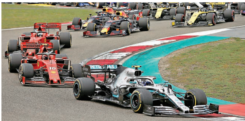
F1大獎賽有望在中國「一站雙賽」。