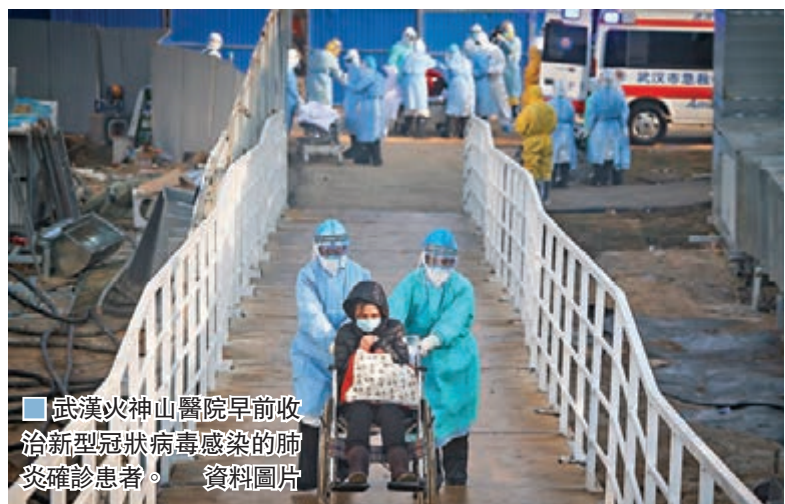
武漢火神山醫院早前收診新型冠狀病毒感染的肺炎確診患者。資料圖片

其中，國家疾控中心要解決科研研發、實驗室檢測、業務指導和病原學分析等「一錘定音」的能力；省級疾控中心要加強區域防控工作的指導、監督、質量評估和人才培養方面作用；市和縣級疾控中心要進一步加強現場流行病學調查和地區性傳染病疾病譜的日常監管和監測。縣級疾控中心和社區醫療機構要夯實基礎，加強社區的管理和防控，在基層築牢防病的基礎。