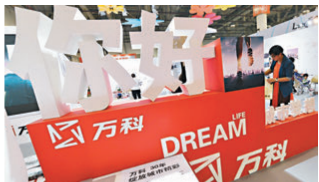
萬科表示本次配售的所得款項淨額，將不會用於境內住宅開發。

香港文匯報訊(記者岑健樂)萬科(2202)昨公布，配售約3.16億H股新股，作價為每股25元，較昨日收市價26.85元，有近6.9%的折讓。配售股份分別佔擴大後之全部已發行H股及全部已發行股本約16.67%及2.72%，集資淨額約為78.65億元。