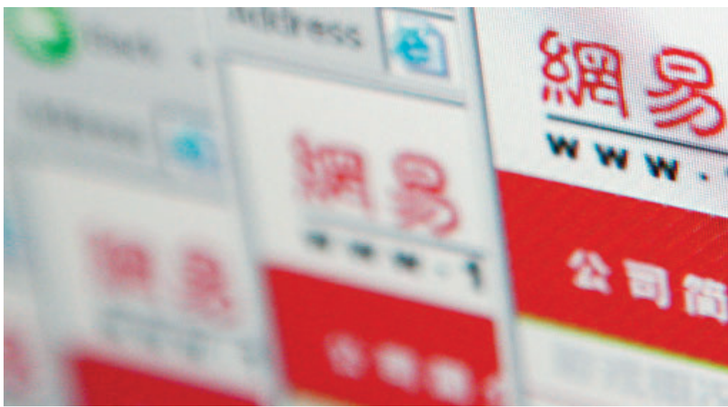
網易成港股最受歡迎新經濟股，熱度遠勝當時超購40倍的阿里巴巴。資料圖片

網易昨日截止存展認購，市場作最後衝刺，單日存展額高達330億元。各大券商中，耀才借出200億元，輝立錄187億元，富途為115.5億元，信誠借出100億元，大華繼續借出100億元，英皇、凱基、時富分別借出52億元、50億元和8.3億元。