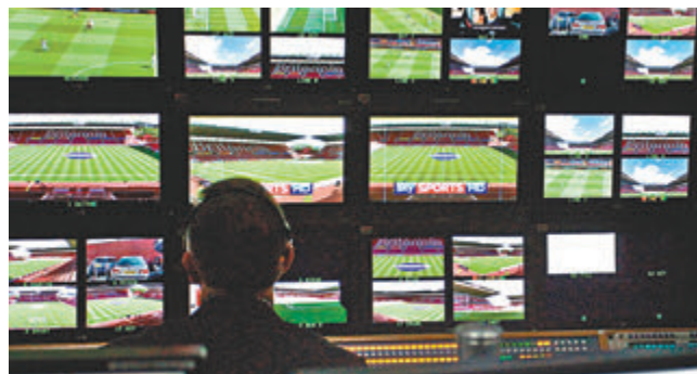
■ 英超足球比賽的直播畫面。

英超暫定於6月17日重啟賽事，不過20支球隊對復賽日期仍有分歧，有球會希望再次延期以得到更多準備時間。英超賽會則警告，球季遲遲未能完成將會令到所有球隊「錢途」受損，由於賽季停擺，所有英超球隊已合共需要退還3.3億英鎊（約合32億港元）予轉播商，若未能在7月26日或之前完成球季，每周更會額外損失3,500萬英鎊，相信在財政壓力之下各支球隊也會陸續妥協。 ■香港文匯報記者 郭正謙