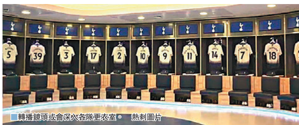
■ 轉播鏡頭或會深入各隊更衣室。

香港文匯報訊（記者 郭正謙）憑藉巨額轉播費收入，英超向來是富絕歐洲聯賽。不過，足壇遭遇寒冬，英超各球隊亦不免要精打細算「節衣縮食」。為了能夠減少還款金額，復賽後的英超或會答應轉播商的一系列革新，包括破天荒在賽後更衣室進行直播，為球迷帶來前所未有的體驗。 球季停擺本來對英超各隊已做成不小的財政壓力，球隊或迫於無奈接受轉播商的一系列新建議，以換取退還金額的減少。新建議包括：擴大更衣室的採訪範圍、在重大慶祝活動中容許在更衣室採訪、賽前進入更衣室採訪、延長賽後訪問時間，以及半場加插球員採訪環節。