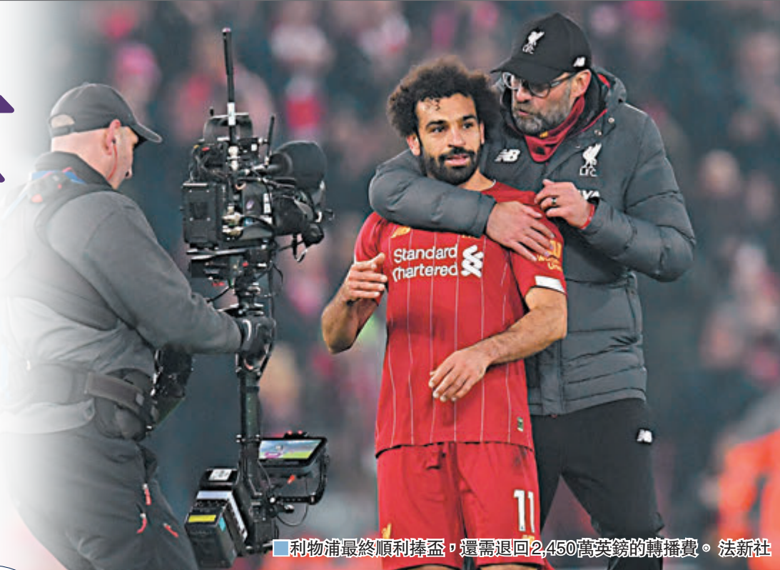
■ 利物浦最終順利捧盃，還需退回2,450萬英鎊的轉播費。