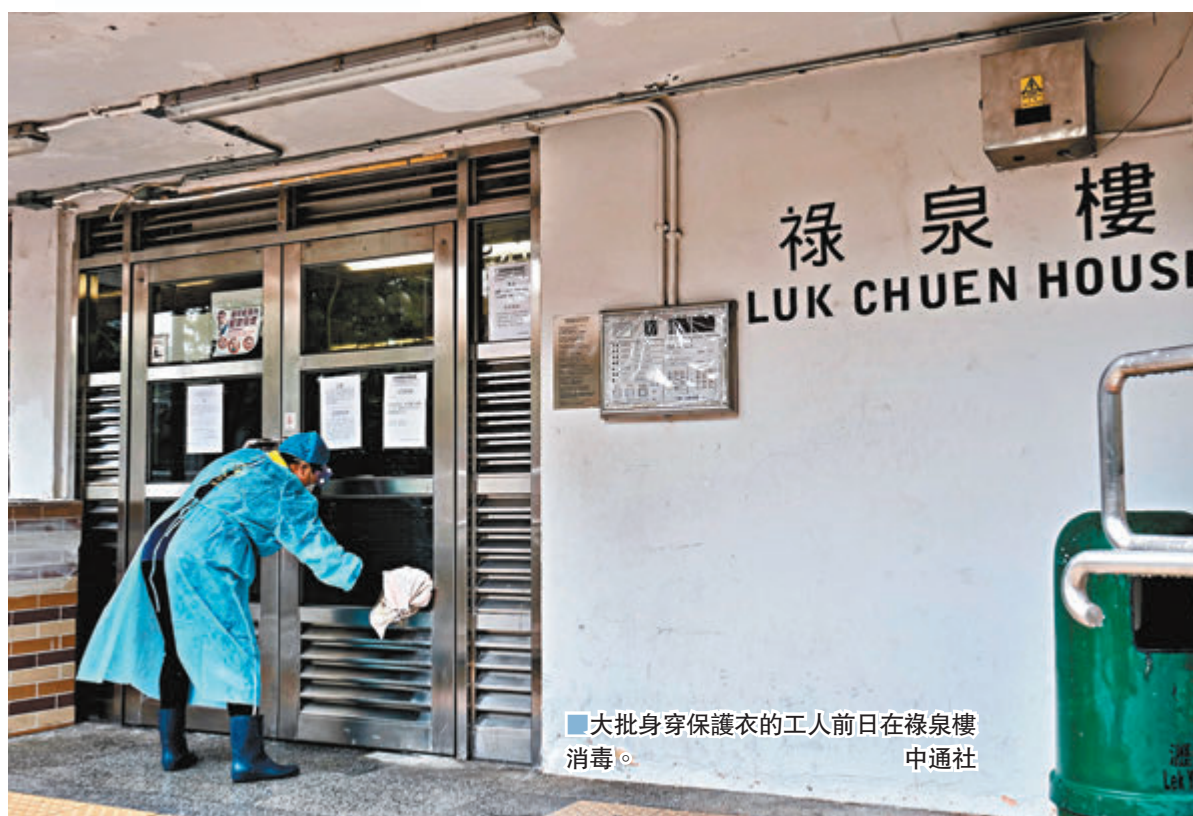
■大批身穿保護衣的工人前日在祿泉樓消毒。