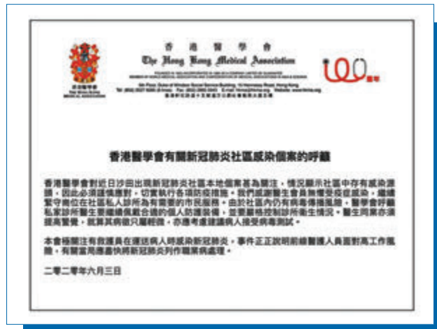
■香港醫學會昨日發表聲明，呼籲私家醫生做好防疫措施，並須提高警覺。