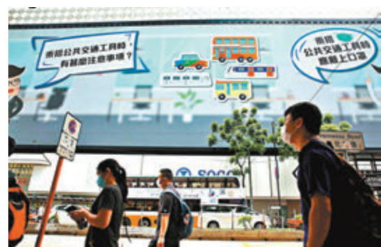
■陳肇始感謝市民自律。

估及了解部分國家和地區的疫情後，可隨時放寬有關抵港人士的檢疫安排，例如有關人士符合部分條件，包括病毒檢測呈陰性，入境香港時可免除強制檢疫。