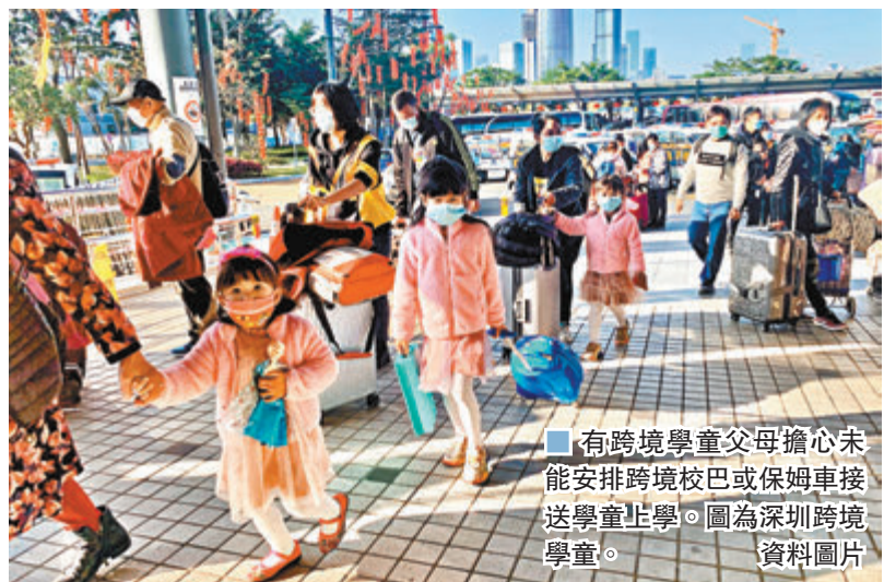
■有跨境學童父母擔心未能安排跨境校巴或保姆車接送學童上學。圖為深圳跨境學童。

他表示，已向教育局反映上述跨境學童家長的顧慮，並強烈要求教育局必須提供充足的校巴和保姆車，以及足夠的保姆人員，協助年幼的學童過關上學及保障他們的安全。