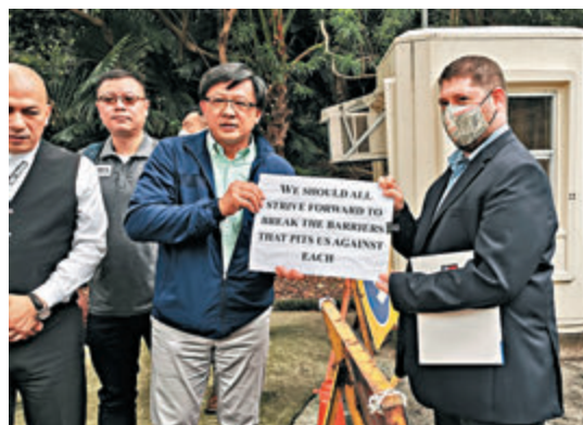
何君堯代表向美國領事館職員遞交請願信。