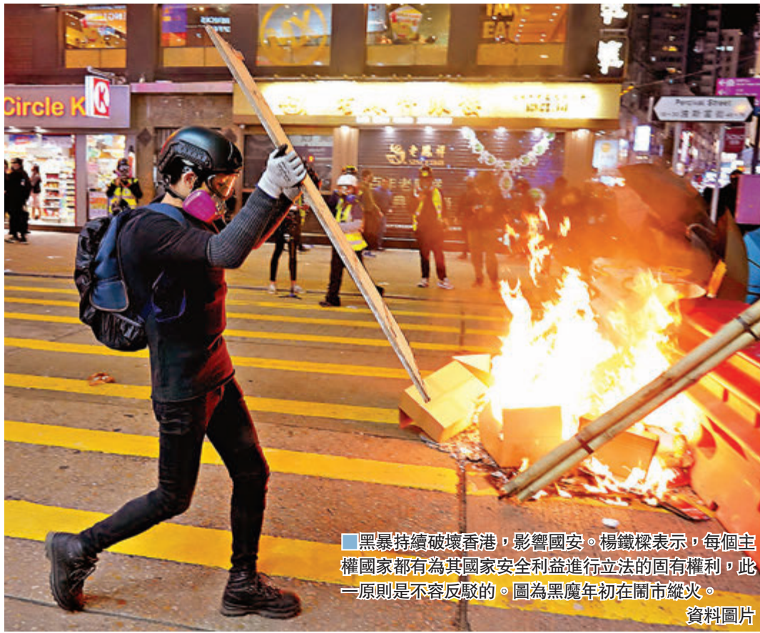
黑暴持續破壞香港，影響國安。楊鐵樑表示，每個主權國家都有為其國家安全利益進行立法的固有權利，此一原則是不可反駁的。圖為黑魔年初在鬧市縱火。

李國能認為，國安法設計着意於符合香港的法律制度。為達到此目的，國安法應當與建基於普通法的香港法律制度原則連貫一致。