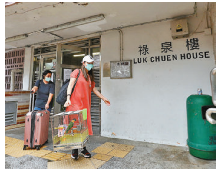
▲有居民拖着行李箱暫時遷離。