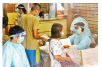
▲居民批署方只在辦公時間開設櫃位。

另一名瀝源樓住戶徐先生則表示，有家人替他們遞交樣本瓶，惟排隊的時間很長，「檢測是好事，起碼令大家安心。」但他亦認為櫃位服務時間太短，「聽聞有住戶覺得麻煩，放棄交還樣本瓶，甚至會扔棄樣本瓶，聽說有200多人仍未交回樣本瓶。」他希望政府改善情況，「查緊啲啦，未交個200幾個如果有人中招，咁味好大鑊。」