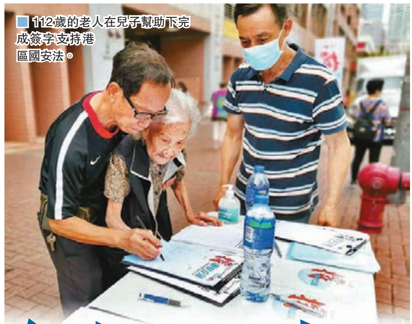
■112歲的老人在兒子幫助下完成簽字支持港區國安法。