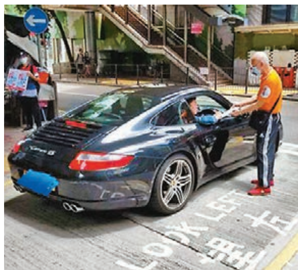
■私家車司機路過中環街站，主動停車要求簽名。

現年45歲的阿輝則從事運輸行業，他直斥，持續快一年的黑暴分裂社會，搞得神憎鬼厭。他又指自己從未擔心上街清潔文宣，會招惹「殺身」，「我做嘅事正確，光明正大！」