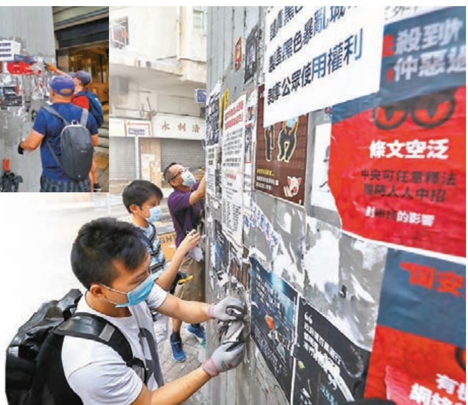
▶義工昨日於香港多地清除黑暴文宣。