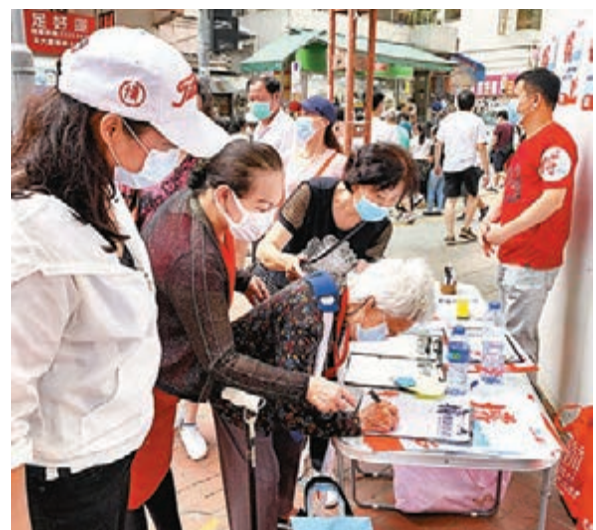
■101歲的高齡婆婆仍親身到場簽名。