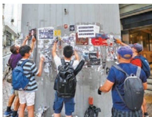
▲義工小隊盼以行動向市民宣傳清除黑暴的必要性。