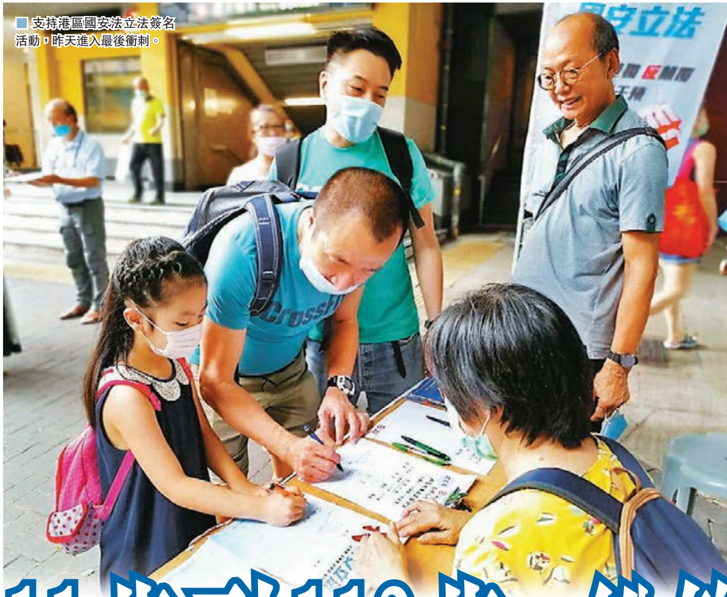
■支持港區國安法立法簽名活動，昨天進入最後衝刺。

在中環街站，路過的私家車司機主動停車簽名支持港區國安法立法；在九龍街站，101歲的高齡婆婆親身到場簽名；在黃大仙東頭邨口，112歲人瑞在兒子攙扶下簽名……「香港各界撐國安立法聯合陣線」發起的支持港區國安法立法簽名活動，昨天進入最後一日，眾多市民主動前往各區街站簽名，表達希望港區國安法可以盡快立法，讓生活重回正軌。除收集簽名外，同日亦有團體發起撐港區國安法大清潔行動，於港島、九龍、新界多地清除黑暴文宣，向社區宣傳訂立港區國安法的好處及正能量。