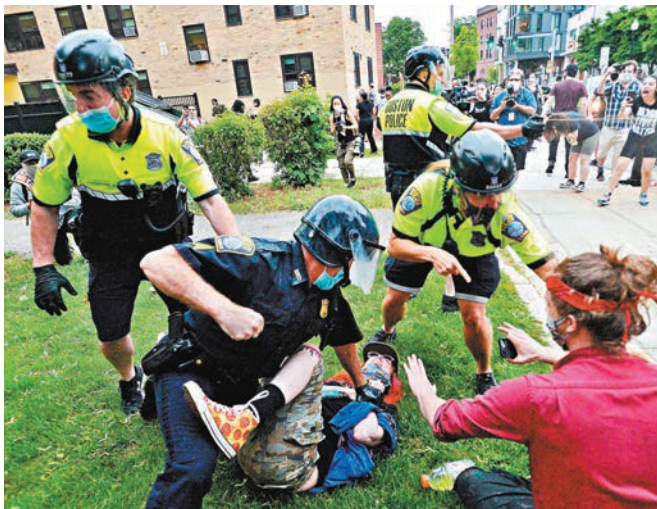
警察粗暴對待示威者，並使用胡椒噴霧。

特朗普上任總統以來屢次捲入醜聞，更成為美國史上第三位被彈劾的總統，雖然參議院在2月選其「清白」，不過其後美國又即因華府抗疫不力、疫情大爆發。《華郵》指出，彈劾、疫症或警暴觸發示威等，在美國雖均有先例，但各項事件在短時間內連續出現，加上特朗普作風不斷挑戰社會常態的底線，社會焦慮情緒便更趨嚴重。