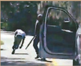
黑人男子亞伯里外出時被白人槍殺。資料圖片