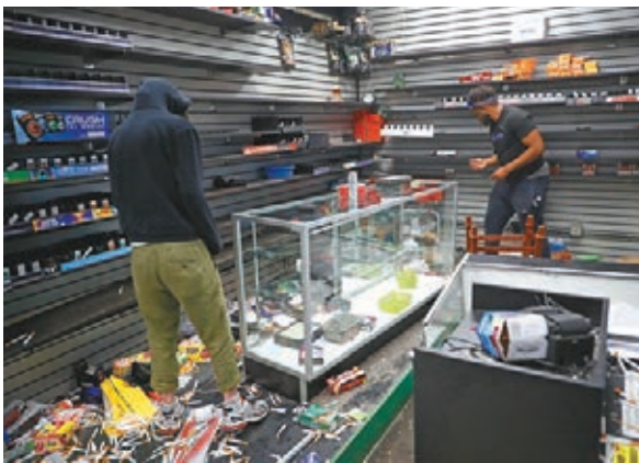
有人趁示威期間洗劫便利店。

在2016年大選，特朗普於曾是前總統奧巴馬票倉的200個縣內，成功爭取白人選民支持，得以擊敗對手希拉里，而這些白人選民的立場溫和，未如南部的特朗普支持者般強硬，亦不認為警方對黑人的執法方式存在問題。有見及此，特朗普自然希望複製這項勝選方程式，試圖製造更多種族分化，令溫和白人選民離棄一向為黑人權益發聲的民主黨。特朗普挑起種族矛盾的伎倆其實早有前科，例如他質疑奧巴馬並非在美國出生，更向美國國會4名有色人種女議員喊話，稱她們應返回家鄉。 特朗普能否打響如意算盤，尚屬未知之數，但他的這種競選策略可能源於自己曾經歷1960年代黑人爭取民權的時期，深知溫和白人選民的取態如何因應時勢而變