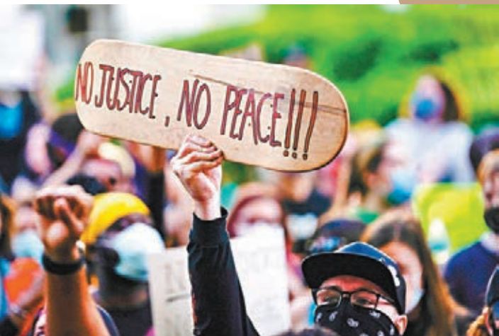
示威者手持標語「沒有正義 沒有和平」。