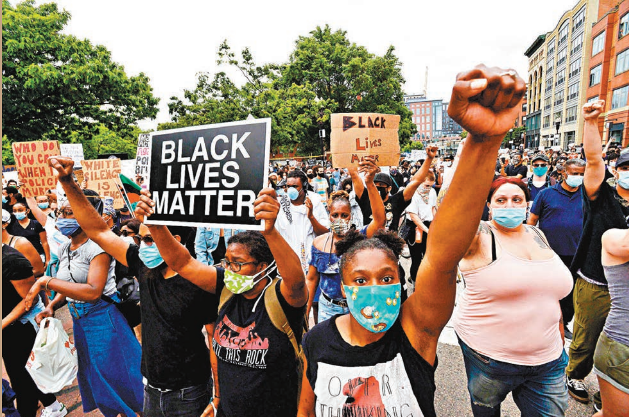
美多地示威者發起抗議，舉起寫有「黑人的命也是命」的標語。