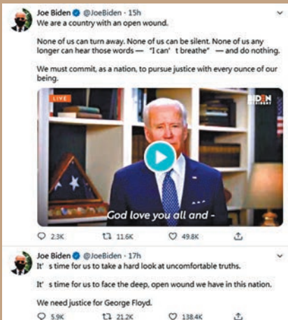
拜登在twitter上連續發帖譴責事件。