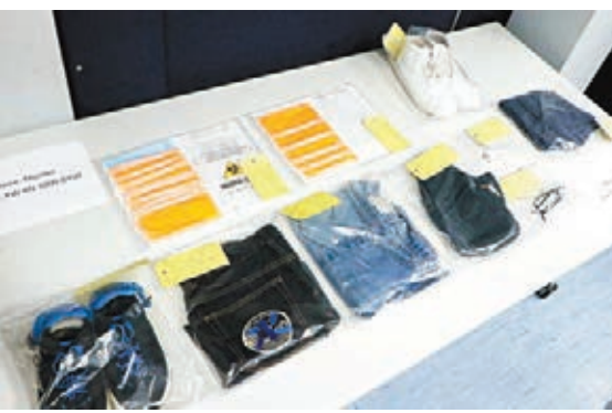
■警方展示兩名兇徒犯案時所穿衣服等證物。

案發於本週日(24日)上午10時許，練婦上班途經基隆街與欽州街交界，懷疑其頸上金鍊惹來兩名匪徒尾隨跟蹤。當她沿荔枝角道行至距深水埗警署不遠的長沙灣蔬菜批發市場對開時，兩名匪徒突然從後用硬物向她頭頂襲擊，搶去她頸