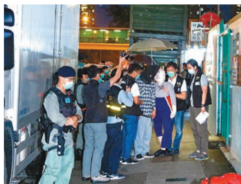
■警方一度搬來假人模擬當日案發過程。

西九龍總區及深水埗警區人員翻查案發現場及附近多段閉路電視片段，鎖定兩名涉案疑犯，並於昨日凌晨拘捕兩名疑犯，檢獲兩人犯案時所穿衣服和變賣金鍊的單據。警方初步懷疑姓陳男子下手打劫，另一男則負責把風，兩人犯案後到牛