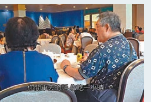
■林Sir最愛帶妻子到不同餐廳享受美食。

控方申請將案件押後再訊，包括翻查閉路電視、被告手機、指紋及基因鑑證，及化驗涉案電油。主任裁判官錢禮批准被告以1萬元人事擔保、1萬元現金保釋，但須遵守晚上12點至翌早8點宵禁、每周到警署報到3次、其間不准離港及以及居於指定地址等條件。