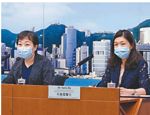
▲張竹君(左)昨日公布，新增3宗由巴基斯坦輸入確診個案。

樹的66歲女子及其5歲孫女確診，而她的丈夫翌日亦確診。衛生防護中心傳染病處主任張竹君昨日在疫情簡報會上則公布，新增的3宗由巴基斯坦輸入確診個案，包括第一千零八十一及第一千零八十二宗的38歲父親和其8歲兒子，兩人2月3日至5月28日期間在巴基斯坦，剛抵港時病毒測試結果不確定，覆檢證實確診。另一宗的一歲男童，其母親前日已確診。男童因年紀太小，無法在機場留喉唾液樣本，入住檢疫中心後由醫護人員抽取咽喉樣本，測試呈陽性。