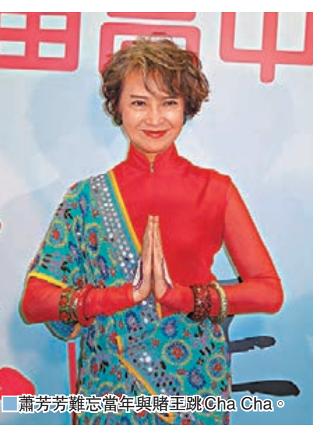
蕭芳芳難忘當年與賭王跳Cha Cha。

香港文匯報訊 (記者 阿祖) 「賭王」何鴻燊一向都是位大慈善家，而蕭芳芳息影後亦致力於由她創辦的護苗基金，幫助有需要的家庭。曾於2000年，蕭芳芳籌辦的《護苗基金星輝夜》在TVB上直播，邀請得何鴻燊與「肥姐」沈殿霞合唱Nat King Cole的經典作品《Pretend》，並與趙薇合唱鄧麗君名曲《月亮代表我的心》；而多年「賭王」的生日，蕭芳芳都有到賀。對於「賭王」逝世，蕭芳芳回應說：「多年來，他對護苗基金的支持沒話說，最記得他肯同我一起上TVB跳Cha Cha，還肯花時間練舞，好感動。」她又提到賭王三太太陳婉珍 (Ina) 也一直支持護苗基金，總主動問她有什麼需要幫忙的。蕭芳芳說：「何博士走了，我很難過，也跟他太太Ina聯繫上，請她節哀順變。」