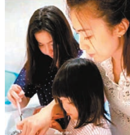
甘比兩個女兒都有幫手。