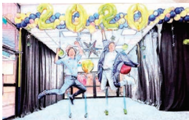
哈林父子高興得齊聲歡呼。