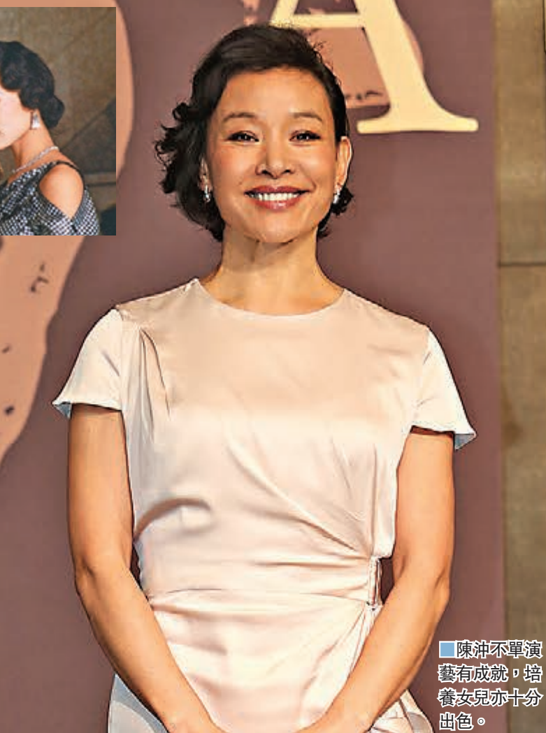
陳冲不單演藝有成就，培養女兒亦十分出色。