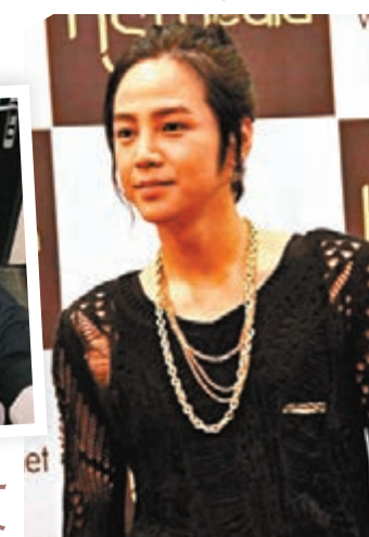
張根碩完成為期兩年兵役。