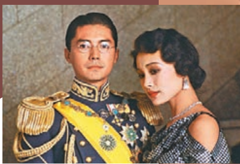
尊龍(左)及陳冲當年主演的經典電影《末代皇帝》。