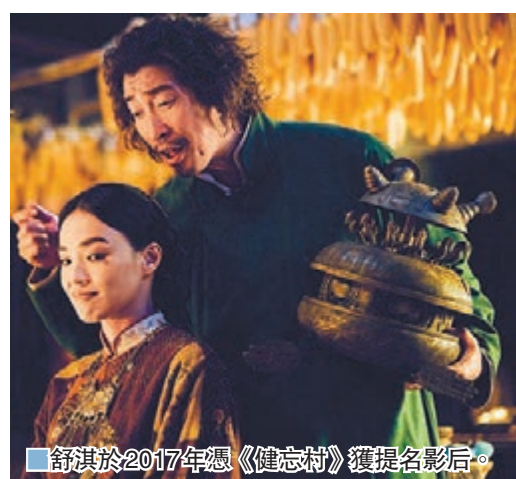
舒淇於2017年憑《健忘村》獲提名影后。