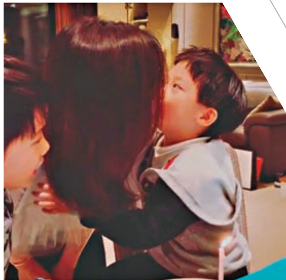
佘詩曼生日獲契仔獻吻。