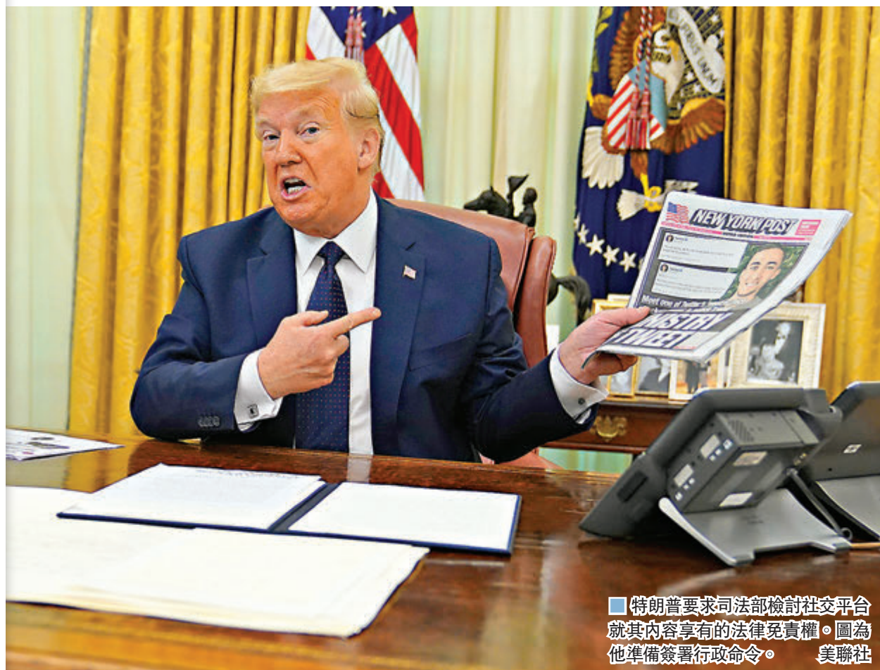
特朗普要求司法部檢討社交平台就其內容享有的法律免責權。圖為他準備簽署行政命令。