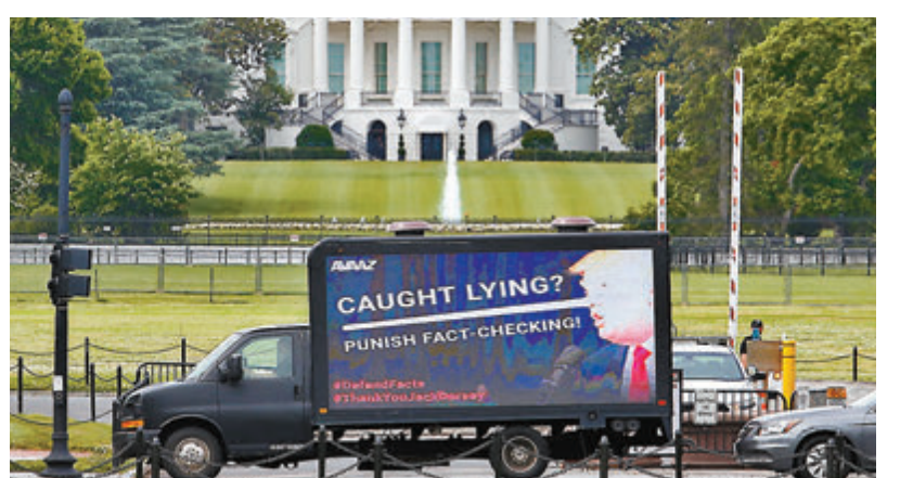
有停泊在白宮外的貨車車身諷刺特朗普因被發現講大話，而懲罰查證事實的一方。