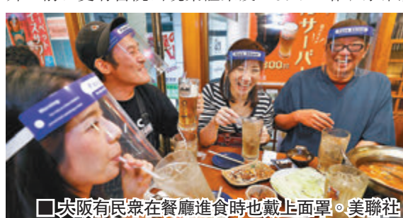
大阪府有民眾在餐廳進食時也戴上面罩。