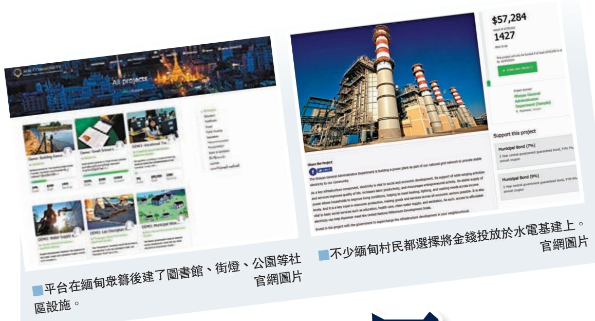
平台在緬甸眾籌後建了圖書館、街燈、公園等社區設施。