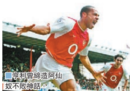
亨利曾締造阿仙奴不敗神話。

亨利是阿仙奴傳奇頭號前鋒，領軍寫下2004年不敗英超冠軍神話。不過，曼聯時任領隊費格遜昔日團隊要員基利透