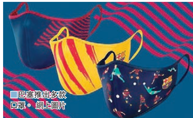
巴塞推出多款回罩。

皇馬的宿敵巴塞隆拿方面，球會官網日前開賣了九款可重用口罩，當中成人、「中童」、兒童用口罩各三款，設計全部都以巴塞為主題。據介紹，口罩每個售價為18歐元(約160元)，均符歐盟醫療用標準，並可以清洗重複使用約40次。