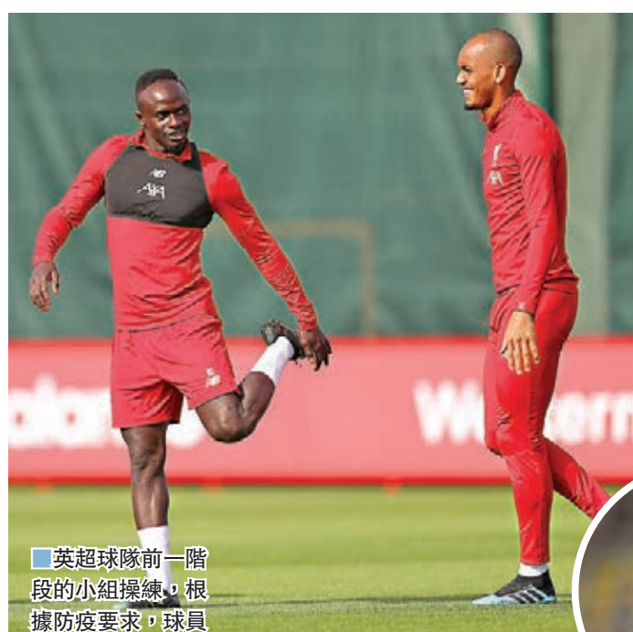
英超球隊前一階段的小組訓練，根據防疫要求，球員需要保持適當距離。