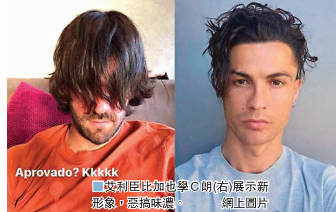
艾利臣比加也學C朗(右)展示新形象，惡搞味濃。

兩大當今「球王」後生造型鬥一番。日前美斯利淨鬚鬍亮相訓練場，獲不少網民大讚看上去感覺清新和年輕了不少。基斯坦奴拿度(C朗)近日也在社交媒體上分享了一張照片，當中看到他將近日繫起的辮子鬆開了，放下了頭髮，這個造型勾起了球迷對他少時加盟曼聯時的記憶，當時的髮型也是差不多。C朗這個形象卻被祖雲達斯隊友杜格拉斯哥斯達開玩笑，他在網上留下五個又哭又笑的表情圖案。而利物浦的另一位巴西名將艾利臣比加也立即有樣學樣，並將自己一頭亂髮遮面的相片上載到社交平台上。