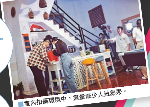
室內拍攝環境中,盡量減少人員聚集。