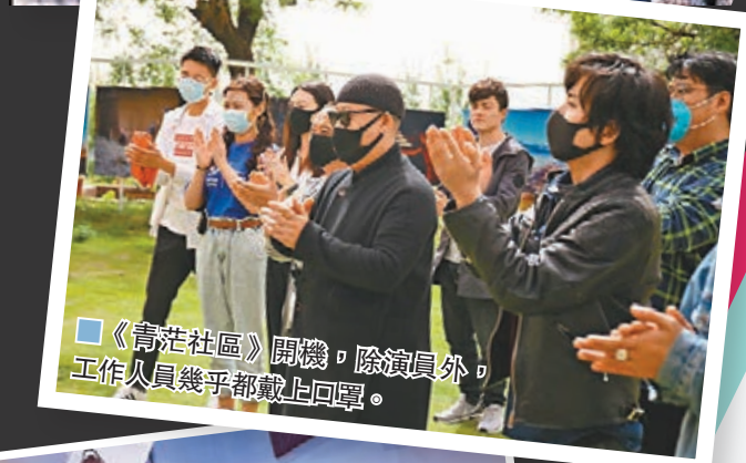
《青苔社區》開機,除演員外,工作人員幾乎都戴上口罩。