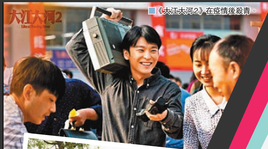
《大江大河2》在疫情後殺青。