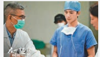
楊洋(中)在《在一起》中演醫生。