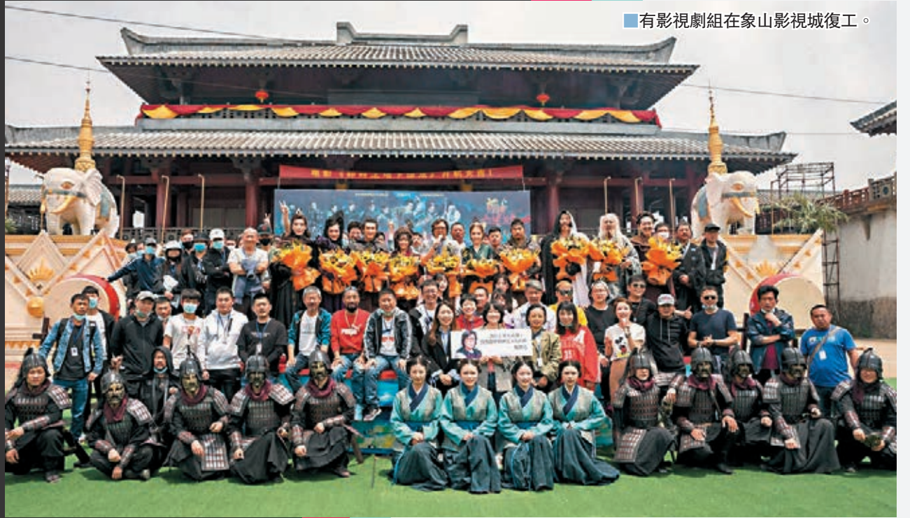
有影視劇組在象山影視城復工。

香港文匯報訊(記者倪夢璟)隨着疫情防控趨穩,內地影視行業逐漸步入正軌。近日,包括趙麗穎、王一博主演的《有翡》,迪麗熱巴、吳磊主演的《長歌行》以及朱一龍主演的《叛逆者》等多部劇組新片復工。然而,影院卻也經歷了復工後又劇停的尷尬,一些備受期待的影片更紛紛撤檔。影視行業肯定是受到了不小影響,也面臨了一定的困難,有業內人士表示,復工陸續進行是一個積極的信號,不少劇組亦力求創新,但疫情衝擊下,未來一些影視項目或面臨資金短缺等問題亦需提前考慮。