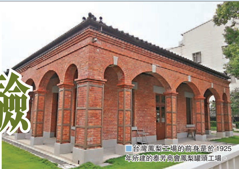
台灣鳳梨工場的前身是於1925年所建的泰芳商會鳳梨罐頭工場。