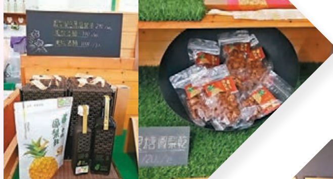
銘泉商店售賣各式各樣鳳梨產品