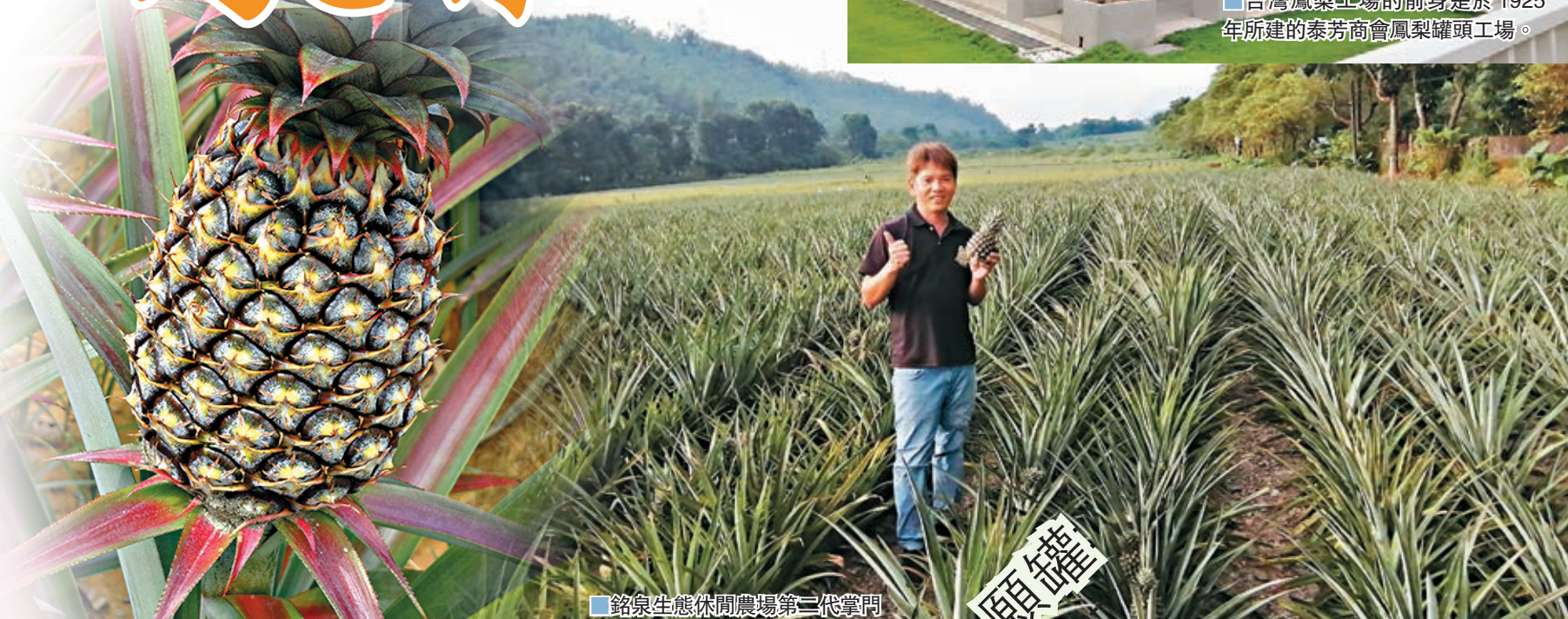
銘泉生態休閒農場第二代掌門