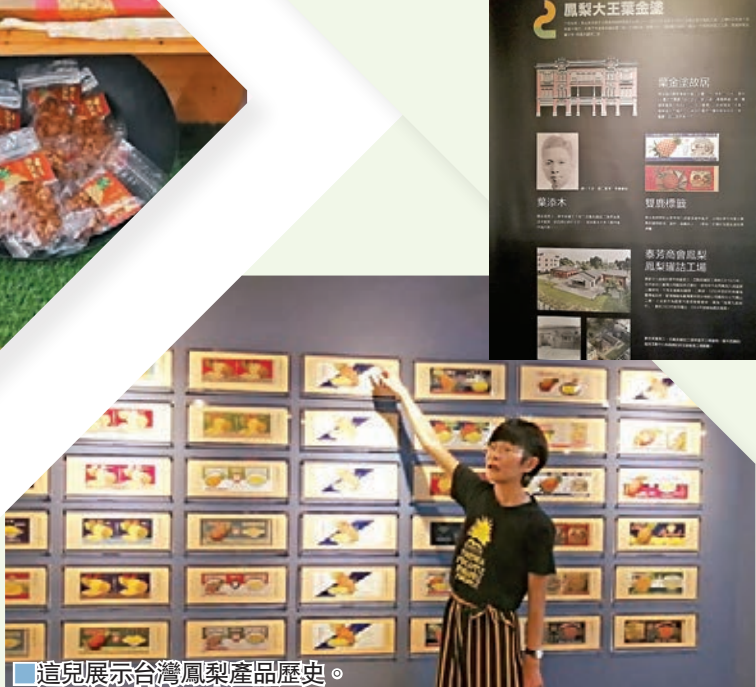
這兒展示台灣鳳梨產品歷史。