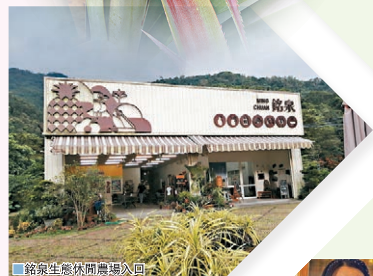
銘泉生態休閒農場入口