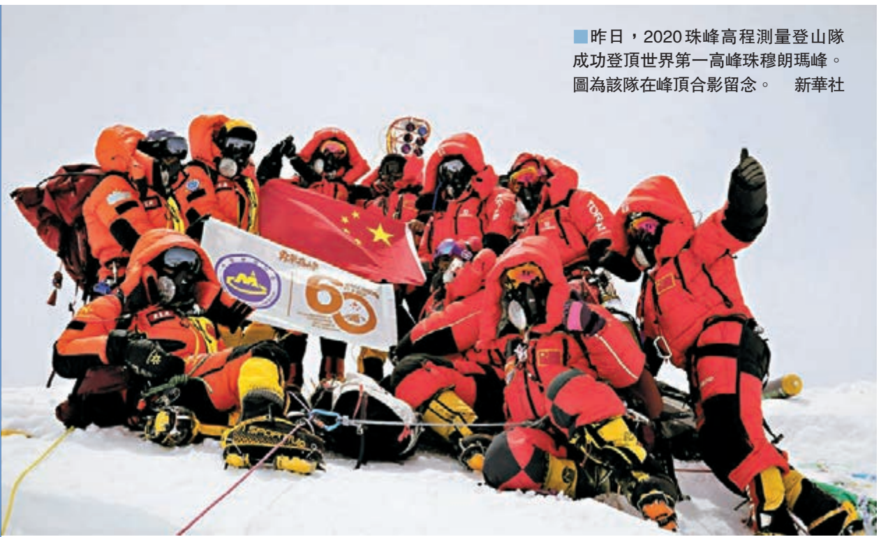
昨日，2020珠峰高程測量登山隊成功登頂世界第一高峰珠穆朗瑪峰。圖為該隊在峰頂合影留念。