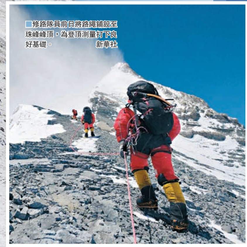
修路隊員前日將路繩鋪設至珠穆朗瑪峰頂，為登頂測量打下良好基礎。

隊員在峰頂停留了150分鐘，其間還開展了峰頂雪深和氣象等測量，創造了中國人在珠峰峰頂停留時長新紀錄。沒有比人更高的山。世界屋脊又一次見證了中國人不懈探索和篤定前行的堅韌。