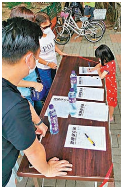
■小朋友也簽名支持港區國安法。

「香港各界撐國安立法聯合陣線」發起線上線下支持港區國安法立法的聯署，市民反應熱烈。繼政務司司長張建宗、財政司司長陳茂波等司局長前日參與街站聯署後，教育局局長楊潤雄、副局長蔡若蓮及政治助理施俊輝昨日亦到由港區潮人聯會設置的街站，和該會會長胡池、副會長林其龍及一眾義工，一起以行動撐港區國安法。 新界鄉議局暨廿七鄉也積極響應，連日來在各鄉收集市民簽名，凝聚撐國安立法力量，以保障國家安全，維護香港繁榮穩定；上水鄉郊坑頭村村公所亦設簽名街