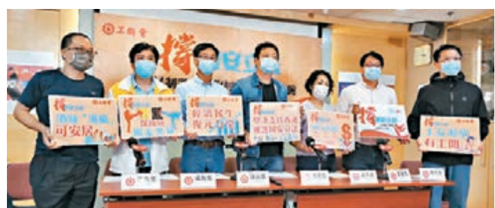
■工聯會支持港區國安法立法，希望法案盡快在港實施，恢復社會秩序，保障打工仔飯碗。

香港文匯報訊(記者文森)黑暴令本港百業蕭條，外加疫情影響，打工仔「五勞七傷」，工聯會昨日引述政府統計數據指出，黑暴重挫零售、旅遊業及飲食三大行業，經濟收益減少近1,200億元，故期望港區國安法盡快立法並實施，以止暴制亂，恢復社會秩序。