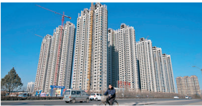
今年首4個月房價漲幅收窄，分析師認為房價短期反彈可能性不大。圖為山西太原一處房地產項目。

極彌補一季度營銷業績的「虧空」，所以會積極推盤和降價促銷，所以導致當前房價處於降溫的通道。另外，部分城市房價出現炒作後，各級政府積極出手，規範了交易秩序，也防範了房價的過快上漲。