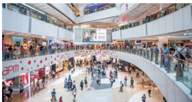
apm的抽獎禮品包括多款100元商場贈券。

新地旗下21個商場於5月22日至6月21日聯手推出「心意分享 人人有獎」活動，消費者於新地商場消費滿300元，即可參加「即抽即中大抽獎」，人人有獎，獎品數量多達20萬份，總值超過600萬元。