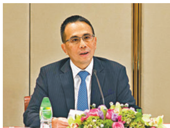
李澤鉅期望，「港區國安法」能穩定香港局勢，恢復社會及經濟活動的正常運作。

香港文匯報訊（記者 梁悅琴）全國人大啓動訂立「港區國安法」程序，多位香港工商界人士表示，「港區國安法」的立法能有效防堵國家安全漏洞，遏止分裂國家、顛覆政權及恐怖主義等行爲，讓香港社會回復平安，讓「一國兩制」成功實施，繼續保障香港的長期繁榮穩定。其中，長實集團主席李澤鉅期望，「港區國安法」能穩定香港局勢，恢復社會及經濟活動的正常運作。