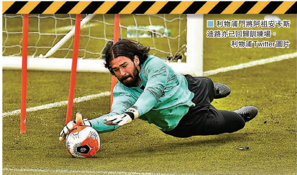
■ 利物浦門將阿祖安卡斯迪路亦已回歸訓練場。