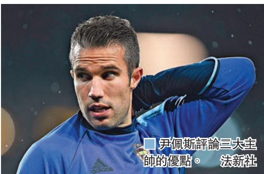
■ 伊佩斯評論三大主帥的優點。