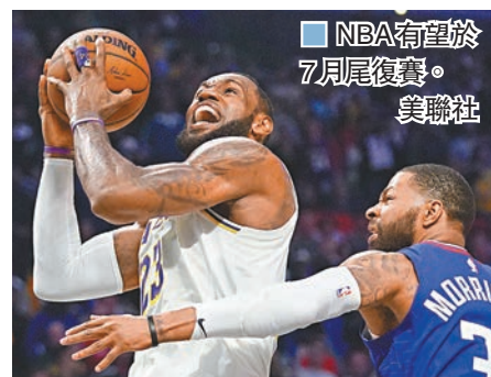
■ NBA有望於7月尾復賽。

另一方面，美國政府似乎亦為運動產業的恢復「開綠燈」，美國國土安全部代理部長沃爾夫昨天表示，將對某些外國運動員免除入境禁令，以方便參加比賽。沃爾夫在聲明中表示：「在目前情