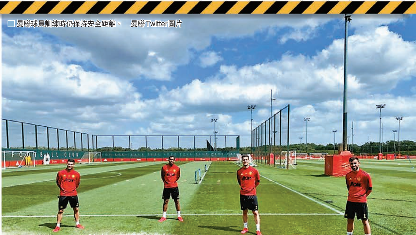
■ 曼聯球員訓練時仍保持安全距離。

英超賽會於過去周六晚公佈第二輪新冠病毒檢測，結果在996名職業球員的檢測樣本中，只有兩名人士確診新冠肺炎，在情況大有好轉下，相信距復賽已再邁進一大步；據報英超賽會會再作第三輪的測試，然後在周三開會商討是否進一步放寬球員近距離的集體操練，並於周四商討賽程和場地安排，不過仍會是閉門作賽。