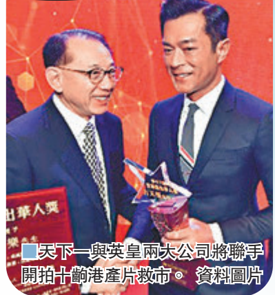
天下一與英皇兩大公司將聯手開拍十齣港產片救市。