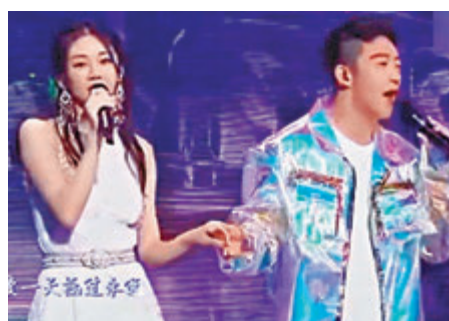
2018年，鄭愷與苗苗攜手合唱。