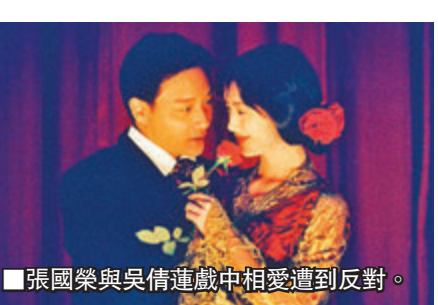
張國榮與吳倩蓮戲中相愛遭到反對。

而作為當年電影投資方的黃百鳴更回憶起製作《夜半歌聲》的小故事，黃百鳴透露原本電影的小劇團青年演員角色韋青是屬意古天樂（古仔）參演：「因為哥哥同時係套戲嘅監製，有個角色覺得好啱古仔，將佢介紹畀我。不過簽晒約，TVB有部劇又想古仔拍，問我可唔可以放期，咁無辦法啦，賣咗個順水人情畀TVB，最後我哋係北京搵咗黃磊演韋青，而古仔之後就拍《陰陽路》還返部片約。」