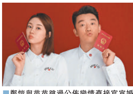
鄭愷與苗苗跳過公佈戀情直接官宣婚訊。