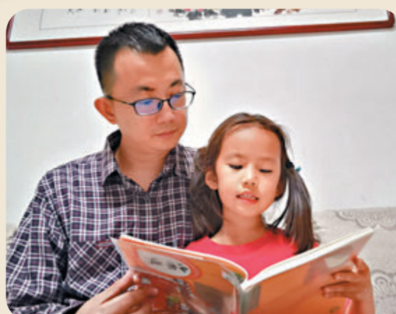
張先生輔導女兒閱讀。

「早上起床晨讀，緊接着就是語文、數學等各種網課，外加英語補習課、『學而思集訓』、體育鍛煉……」張先生說：「因為疫情原因，我們大學沒有開學。4個多月來，我就成了一年級女兒的『全能班主任』。」