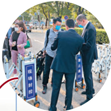
3. 早上5時50分 抵達檢測點

記者們憑有效身份證件進入酒店，兩名安保人員逐一核對信息，安保嚴格。核酸檢測的工作台設於酒店門前的露天院子裡，兩名身著防護服的醫護人員負責為記者檢測。參加核酸檢測的記者被要求站在規定區域內等候，且要保持間隔一米。