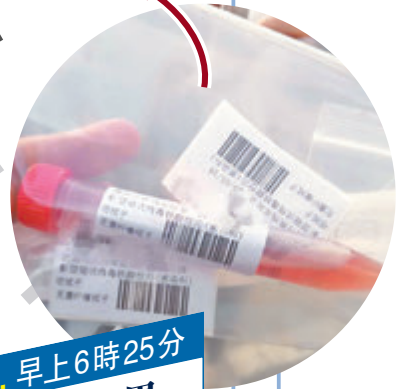
6. 早上6時25分 取樣完畢

記者進入隔離房間，因為是封閉式隔離，每個記者單獨待一個房間。每個房間前都有一個放餐食的小桌子。大會要求記者除了取餐，不得出門，亦不能與其他人交流。記者在房間暫時休息飲食，處理早上採訪的稿件、視頻等，等待檢測結果。