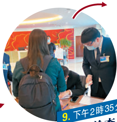
9. 下午2時35分 入場檢查

在回答11個問題後，記者會結束了。因為無法與發言人互動，也無法圍堵追問，記者們略感遺憾。根據大會要求，為確保核酸檢測的有效性，參會記者必須統一乘坐大巴才能離開梅地亞新聞中心，且不允许記者自行下車。至下午5時35分，經多方溝通，記者才得以下車。漫長的一天採訪才結束。