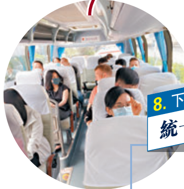
8. 下午2時零5分 統一往會場

進入梅地亞中心後，記者被要求逐一下車進行入場檢查。核對身份後首先要進行疾控登記、測量體溫，隨後才是嚴密的安保檢查。