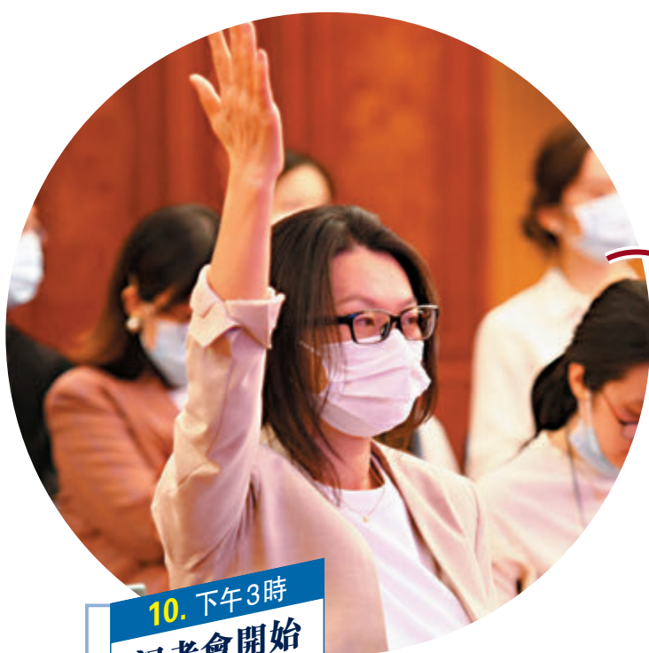
10. 下午3時 記者會開始

全國政協十三屆三次會議新聞發佈會準時舉行。位於梅地亞分會場主席台設置了三塊巨大高清屏幕，實時播出大會堂主會場畫面，畫面清晰，可以讓在場的每一位記者從不同角度清楚地看到發言人郭衛民的每一個動作、眼神和表情。分會場記者提問後，主會場發言人幾乎是無時間間隔回答。記者笑稱雖然是一場「看得見摸不着」的發佈會，但是感覺也是無距離的。