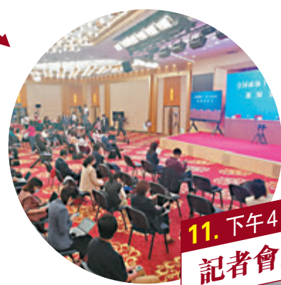
11. 下午4時15分 記者會結束

全國政協十三屆三次會議新聞發佈會準時舉行。位於梅地亞分會場主席台設置了三塊巨大高清屏幕，實時播出大會堂主會場畫面，畫面清晰，可以讓在場的每一位記者從不同角度清楚地看到發言人郭衛民的每一個動作、眼神和表情。分會場記者提問後，主會場發言人幾乎是無時間間隔回答。記者笑稱雖然是一場「看得見摸不着」的發佈會，但是感覺也是無距離的。