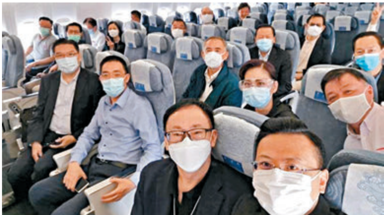
港區代表委員在往北京的飛機上全程佩戴口罩，有代表更戴上眼罩。