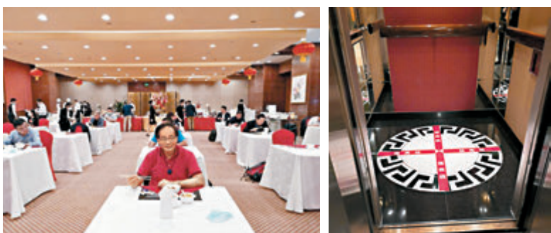
代表委員需保持就餐距離。