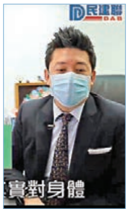
■ 包始源表示，長期吸食大麻對身體有損害。

年，十多分鐘便有十多名大麻賣家主動聯絡。有人慫恿說「隊草」有助解決情緒問題，還有人提出可於半小時內送「外賣」上門。因擔心法律風險，「民記偵探」雖然沒有實際進行交易，但已發現問題十分猖獗，民建聯已將與賣家的對話截圖，預備交由警方處理。