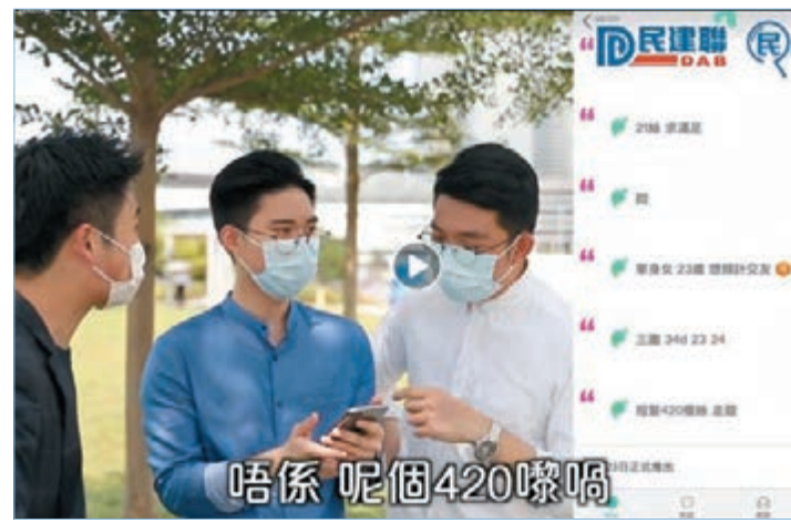
■ 「民記解密」在社交程式「Heymandi」上進行偵查。