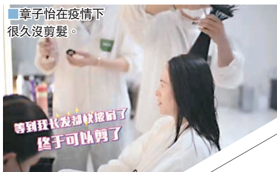
章子怡在疫情下很久沒剪髮。