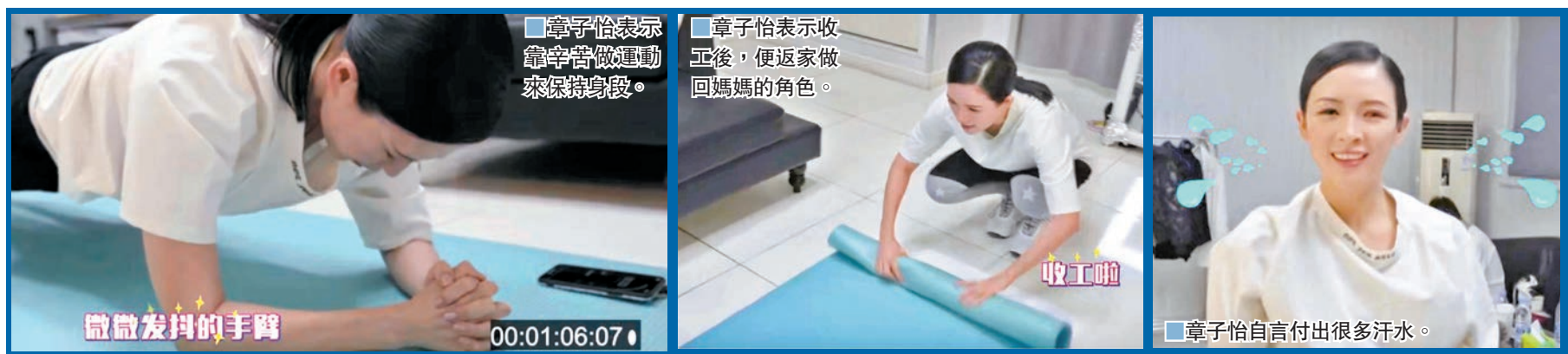
章子怡表示靠辛苦做運動來保持身段。