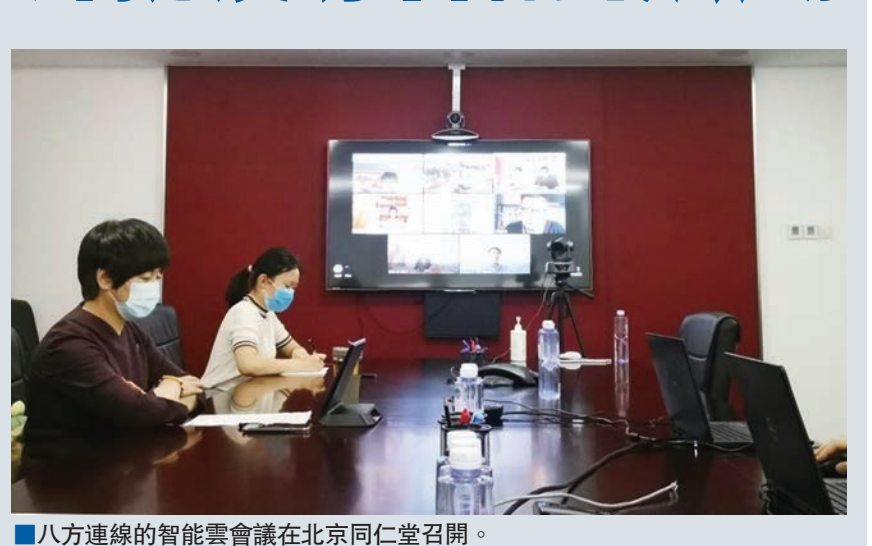
八方連線的智能雲會議在北京同仁堂召開。

日前，八方連線的智能雲會議在北京同仁堂召開。繼向全球公佈用於30個國家和地區的59個中式精準防疫方案後，來自北京、香港、新加坡、馬來西亞、新西蘭、迪拜等地的同仁堂境外專家齊聚雲會議現場，共同探討中醫藥在境外疫情防控中「為什麼能」。