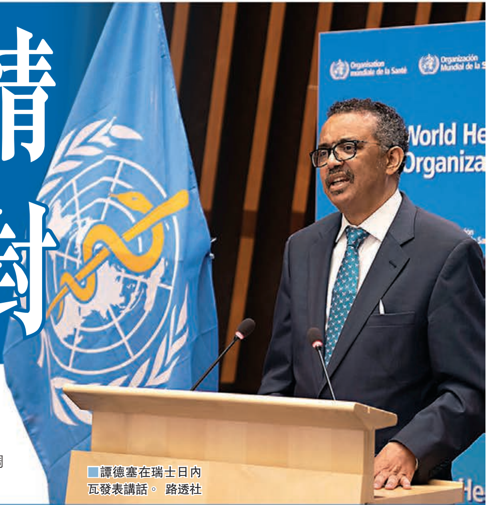
譚德塞在瑞士日內瓦發表講話。

新型冠狀病毒肺炎演變成「世紀疫症」，各國仍努力控制疫情之際，一連兩日的世界衛生大會昨日在瑞士日內瓦揭幕。各國政要以視像方式在會上發言，世衛總幹事譚德塞形容疫情令國際社會學懂謙卑，並警告抗疫之路仍未結束，另外承諾就世衛處理疫情的手法展開獨立調查，其餘多國領袖亦強調合作抗疫的重要性。