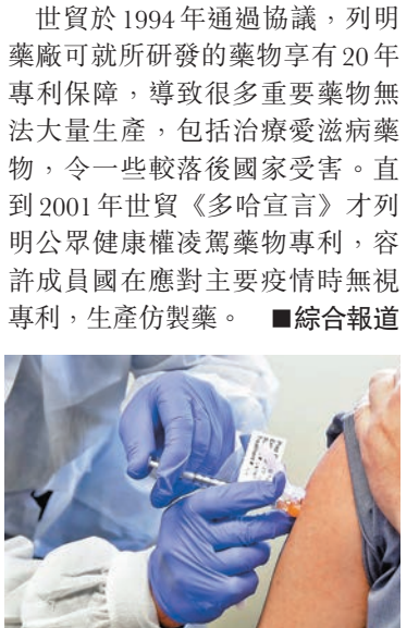
潛在新冠疫苗進行臨床測試。

為確保全人類能夠公平取得新冠病毒疫苗及藥物，歐盟在世界衛生大會提出決議案，呼籲各國