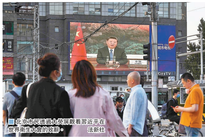
■ 北京市民透過大螢幕觀看習近平在世界衛生大會的致辭。

人類是命運共同體，團結合作是戰勝疫情最有力的武器，是各國人民合作抗疫的人間正道。