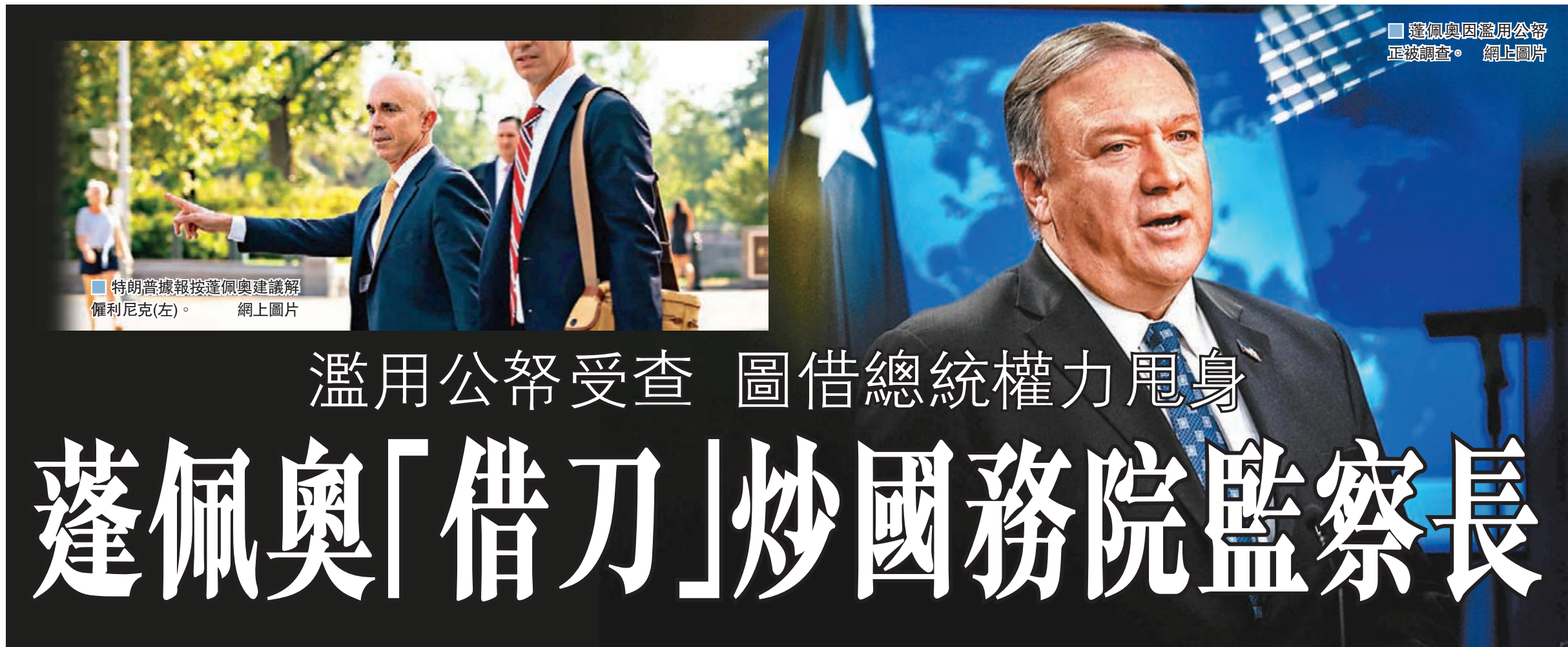
蓬佩奧因濫用公帑正被調查。