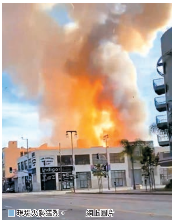
現場火勢猛烈。網上圖片