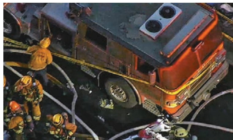
消防車被濃煙熏黑。網上圖片