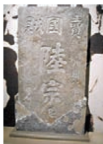
1919年海寧鄉親所立石碑。

陸宗輿的遭遇似乎比曹章兩人還慘，一九一九年六月海寧人召開萬人大會，公決開除陸宗輿，不認陸宗輿為海寧人！筆者作為百年後的一個讀者，會認為姑勿論陸宗輿有沒有「賣國」、「開除鄉籍」屬於「褫奪政治權利」範疇，不應由一個沒有法定司法審判權的「萬人大會」決定。當時海寧鄉親選集資料刻了三塊寫有「賣國賊陸宗輿」的石碑。後來，有輿論指：「陸宗輿是否賣國世人自有公論，及受法律之制裁。該公民等擅自私自立石