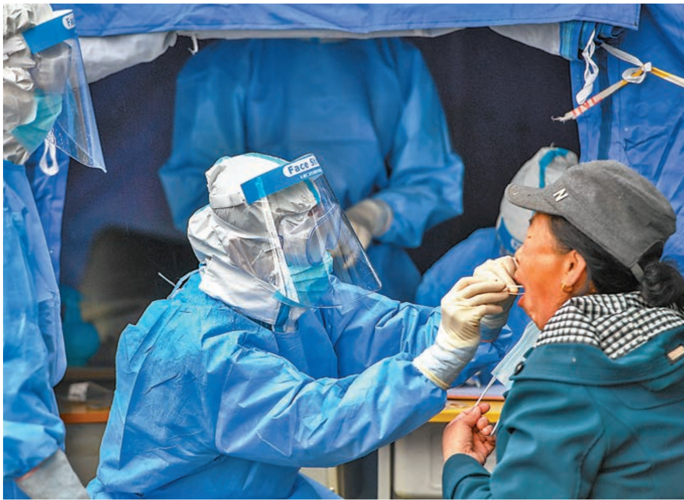
東北地區最近出現聚集性疫情和新發病例，防控工作再升級。圖為吉林省舒蘭市通機小區工作人員為居民採集咽拭子。

針對全球競相開發中的新冠疫苗，鍾南山表示並不樂觀。他說，目前中國已有多個疫苗正進行臨床試驗，但是要找到完美的解決方案，可能還需要幾年時間。