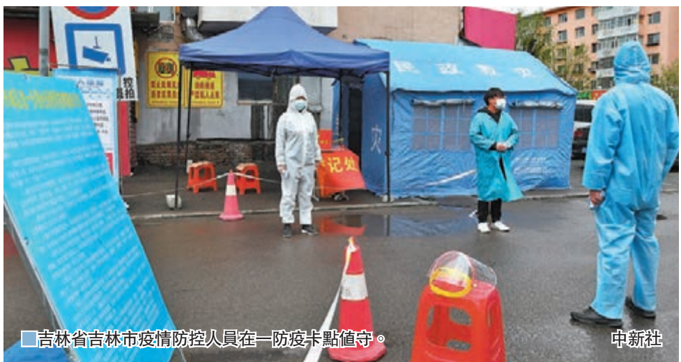
吉林省吉林市疫情防控人員在一防疫卡點值守。中新社