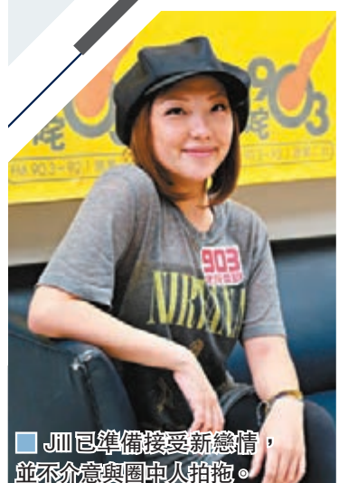
■ Jill已準備接受新戀情，並不介意與圈中人拍拖。

一次性的版權費，以助在疫情下解困，Jill表示：「剛剛申請做會員，但未知有否收到。(現時有否經濟壓力?)也沒有，自問不是揮霍的人，也沒什麼缺乏，足夠基本生活便可以。」