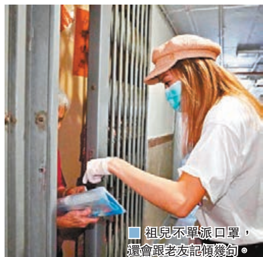
■ 祖兒不單派口罩，還會跟老友記傾幾句。