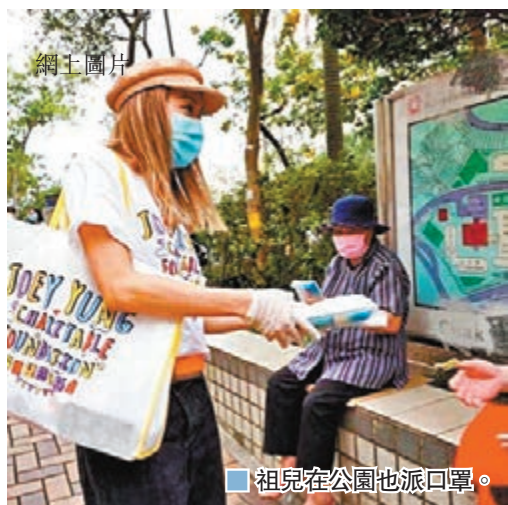
■ 祖兒在公園也派口罩。