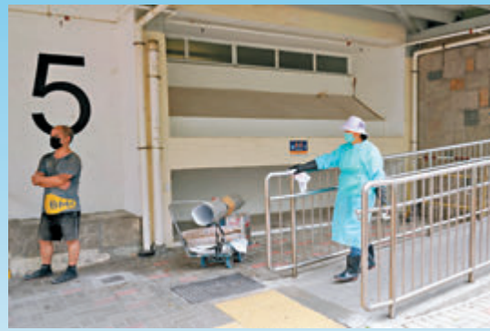
清潔工在梨木樹邨5座樓外清潔設施。