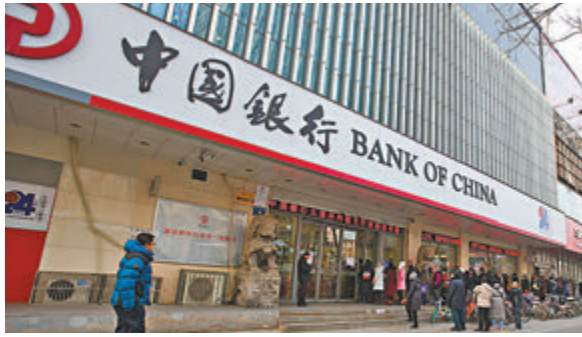
消息指，逾半原油寶投資者已收到賠付。資料圖片

中國(香港)金融衍生品投資研究院院長王紅英對路透表示，中國銀行原油寶產品的出現，是在之前銀保監會鼓勵各個商業銀行在風險可控的前提下，適度產品創新的結果，而且這類產品在銀保監會都已備案，是銀行業在混業發展這個趨勢方向上進行的一種產品探索。因此產品本身從政策層面來看是一個合規產品。但另一方面，由於該產品既可以做多，又可以做空，而且是一種保證金交易的方式，因此從這個角度來說，它其實具備了期貨交易的特徵；從法律的角度來說，它又不是100%的合法，所以從監管角度，這一類業務又要歸到證監會的管理。建信金融研究主管韓會師撰文呼籲，不要浪